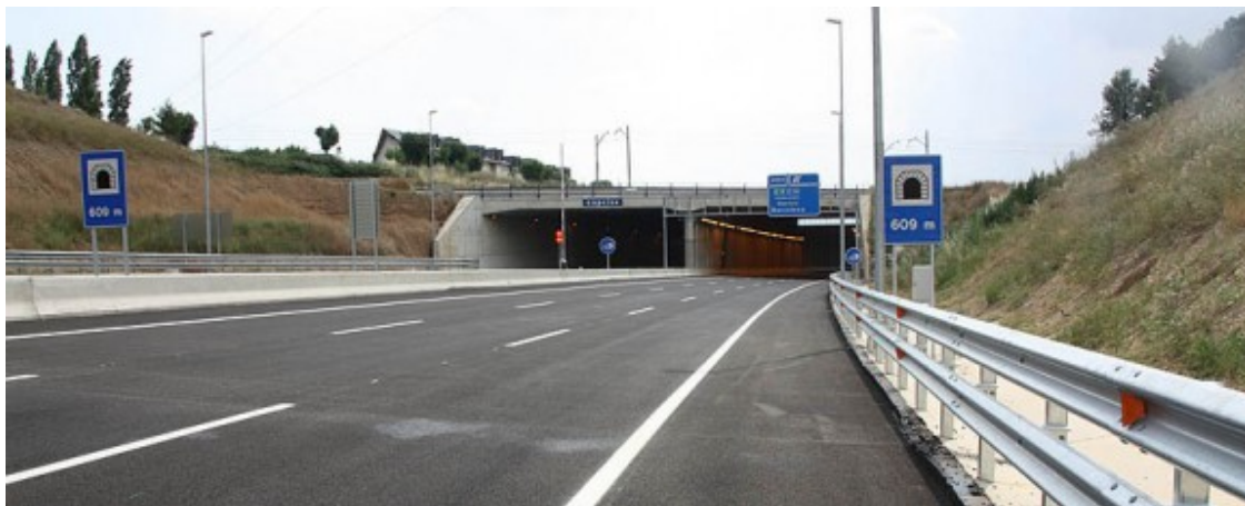
La B-40, entre Terrassa i Viladecavalls.

Una proposta de resolució a la Comissió de Mobilitat ho justifica perquè "el Govern ja està treballant en un pla de mobilitat del Vallès"