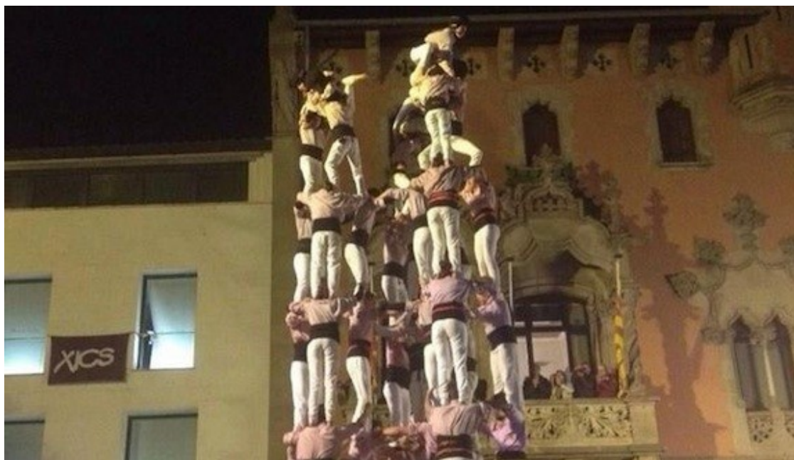
9 de 8 dels Minyons de Terrassa a Granollers

Minyons de Terrassa i Castellers de la Vila de Gràcia completen castells de 9 a Granollers