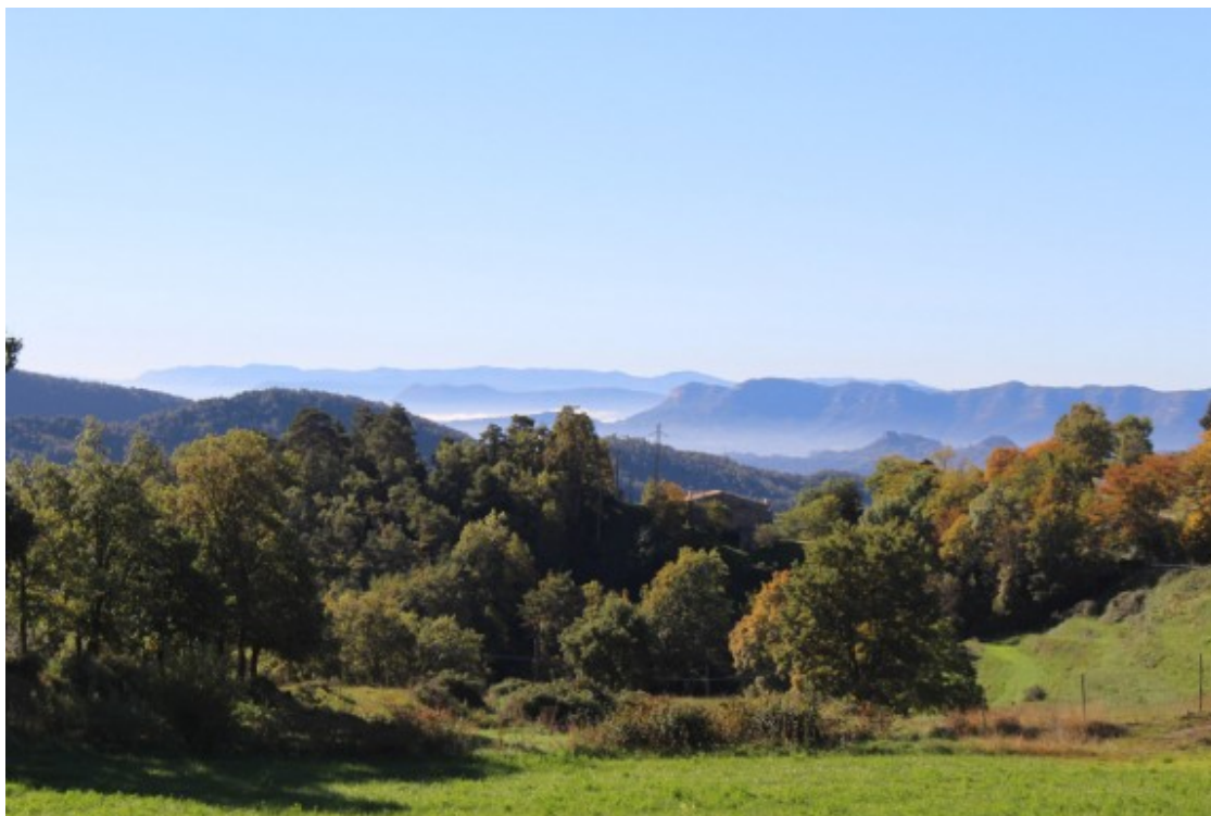
Santa Maria de Besora, la boira de la plana ... al fons

Comencem el nostre recorregut a Santa Maria de Besora