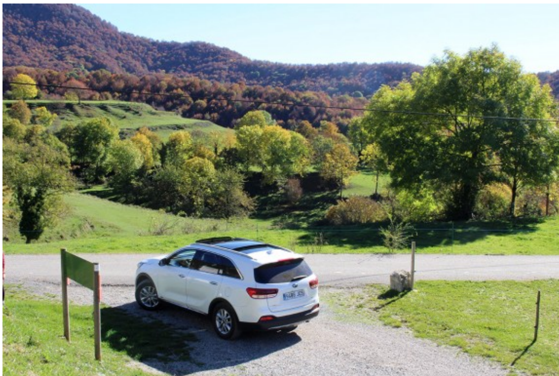
Les vistes des de Ciuret son espectaculars

Desfem el camí per tornar a la carretera de Ciuret ( http://www.turisme.gesbisaura.cat/index.php?option=com_content&view=article&id=92&Itemid=102 ) i fer via cap a aquest encisador nucli de cases de pagès al voltant de l'església de Santa Llúcia (s. XVIII). Els prats de pastura que envolten aquest nucli de cases i les vistes que ofereix l'indret configuren un paratge de gran bellesa.