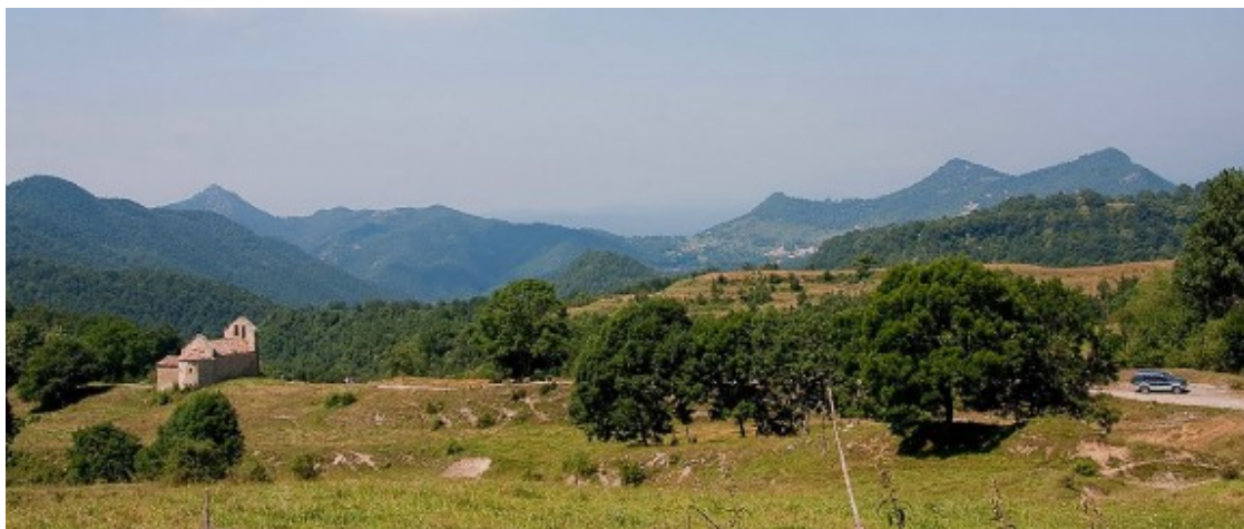
L'Ermita dels Prats. Sant Bartomeu de Covildasses

Desfem el camí per tornar a la carretera de Ciuret ( http://www.turisme.gesbisaura.cat/index.php?option=com_content&view=article&id=92&Itemid=102 ) i fer via cap a aquest encisador nucli de cases de pagès al voltant de l'església de Santa Llúcia (s. XVIII). Els prats de pastura que envolten aquest nucli de cases i les vistes que ofereix l'indret configuren un paratge de gran bellesa.