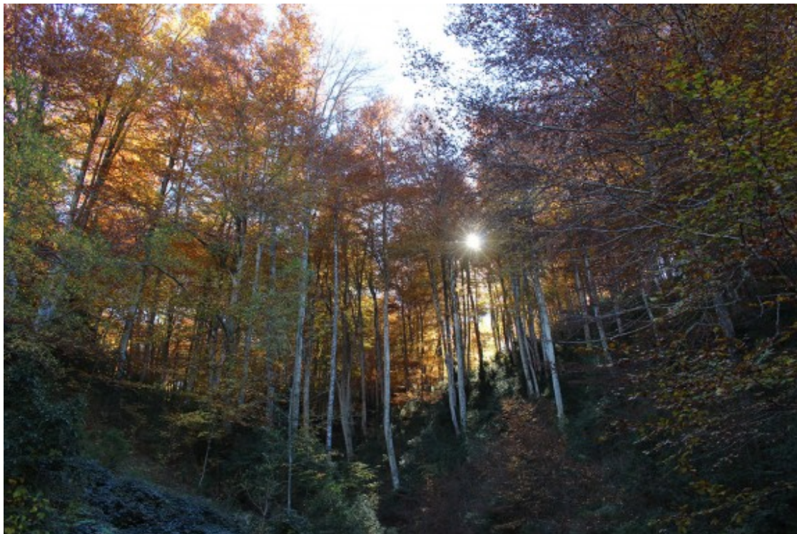
Fageda prop de Collfred

De Ciuret ens enfilem encara més fins a l'altiplà de Collfred. Aquest tram ens submergeix dins del tram de fagedes més exuberants que trobarem al llarg de la nostra ruta. Si fins ara havia estat espectacular ... Obriu bé els ulls i procureu no apartar-los gaire de la carretera.