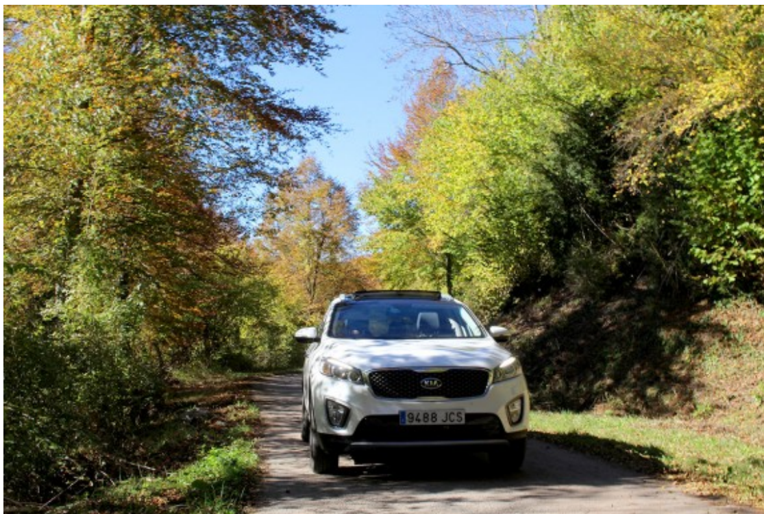
La carretera de Ciuret

Malauradament a la tardor ja no disposem de massa hores de sol i deixem enrere el nucli de Vidrà per reemprendre el nostre camí tot seguint les indicacions a Ciuret. A partir d'aquí la carretera és molt lenta i revirada, poc més que una pista asfaltada. Així que alerta, a poc a poc i a gaudir del paisatge.