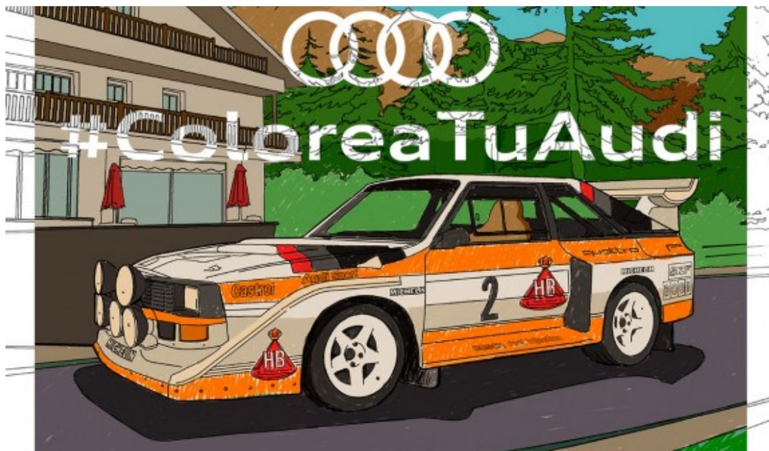
Un S1 Quattro pintat amb els colors de competició originals

La imaginació també podrà volar per donar color a l'Audi TT Coupé, tota una icona del disseny la primera generació va debutar el 1998, tres anys després de l'aparició del concept sobre el qual es va basar finalment el model de producció. Un esportiu que representa el pur plaer de conducció, especialment en la il·lustració per pintar, corresponent a l'Audi TT RS Coupé.