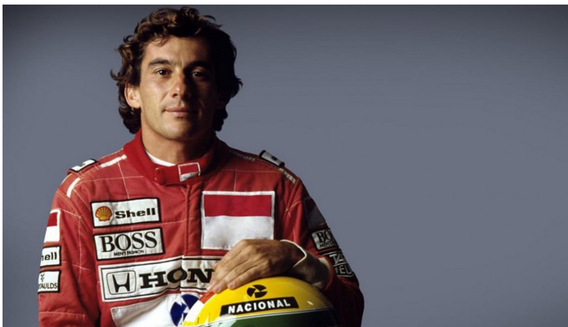
Ayrton Senna un dels grans mites de la F1

En el marc del 25è aniversari de la mort del brasiler es recordarà la desaparició, un dia abans, del pilot austríac Ratzenberger