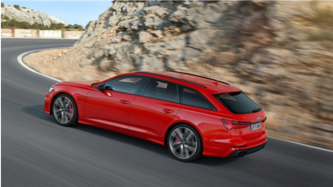
La versió Avant de l'S6 compta amb molt maletes i bona dinàmica

p.p1 {margin: 0.0px 0.0px 2.0px 0.0px; font: 14.0px 'Helvetica Neue'} p.p2 {margin: 0.0px 0.0px 0.0px 0.0px; font: 12.0px 'Helvetica Neue'} p.p3 {margin: 0.0px 0.0px 0.0px 0.0px; font: 12.0px 'Helvetica Neue'; color: #dca10d} p.p4 {margin: 0.0px 0.0px 0.0px 0.0px; font: 12.0px 'Helvetica Neue'; min-height: 14.0px} li.li2 {margin: 0.0px 0.0px 0.0px 0.0px; font: 12.0px 'Helvetica Neue'} span.s1 {color: #000000} span.s2 {font: 10.0px Menlo} ul.ul1 {list-style-type: disc}