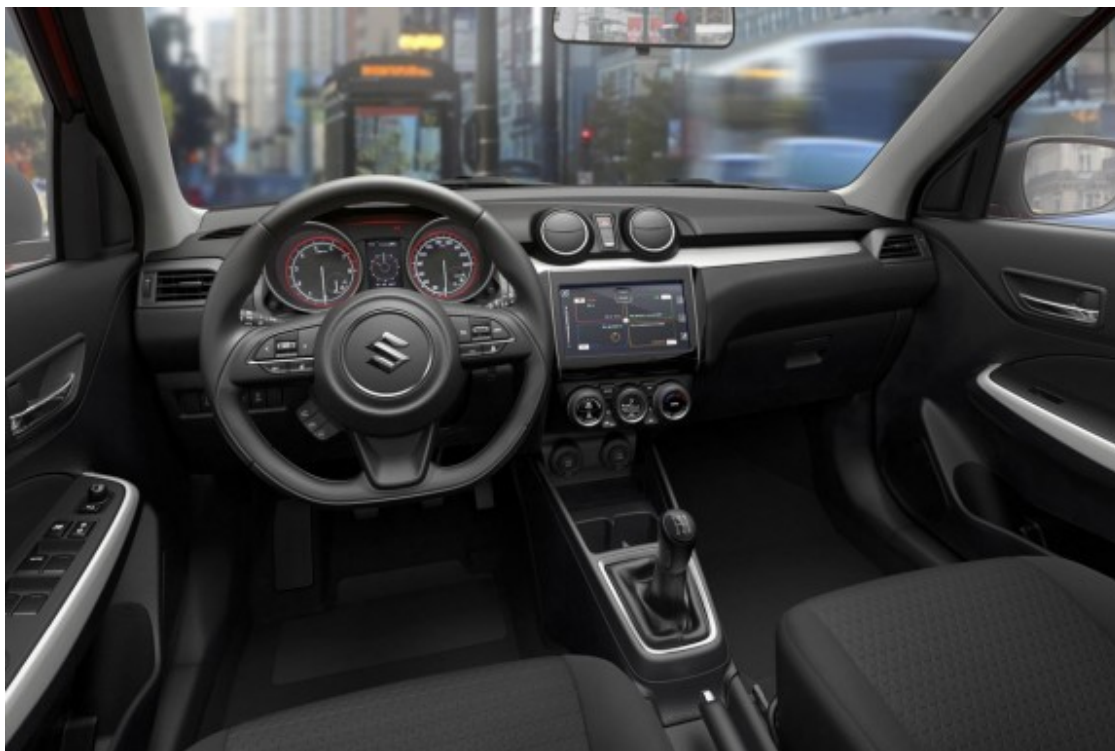
L'interior del Swift es absolutament nou

El Nou Swift munta per primera vegada un avançat sistema de detecció de Suzuki que combina una càmera monocular amb un sensor làser que ofereixen avançades funcions de seguretat com la frenada d'emergència autònoma, l'alerta de canvi de carril i l'assistent de llums de llarg abast.