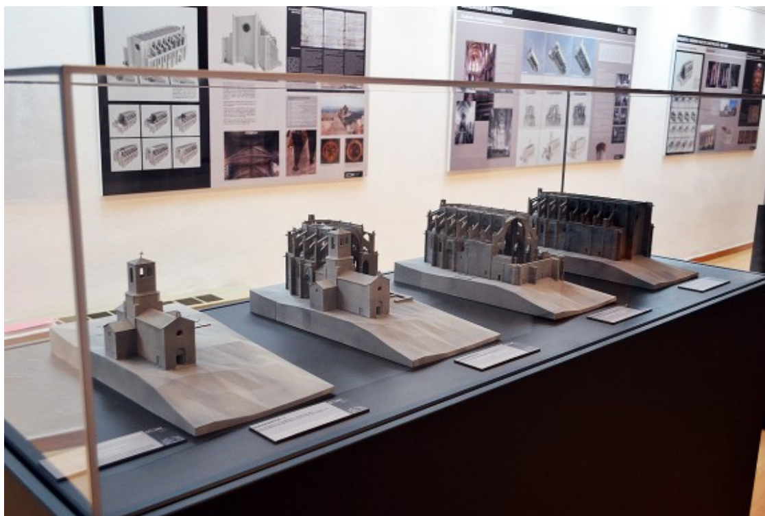
Maquetes de l'església romànica de Santa Maria i de les primeres etapes de construcció de la Seu.

[h3]Buscant un lloc permanent per a explicar la Seu[/h3]