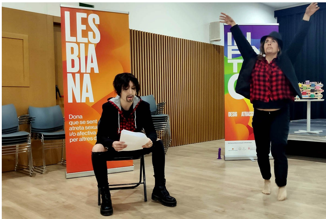
Inauguració de l'exposició «Infinites» a Sant Vicenç de Castellet | CCBages

La mostra, que compta dotze plafons i altres materials divulgatius, s'estrena a Sant Vicenç de Castellet