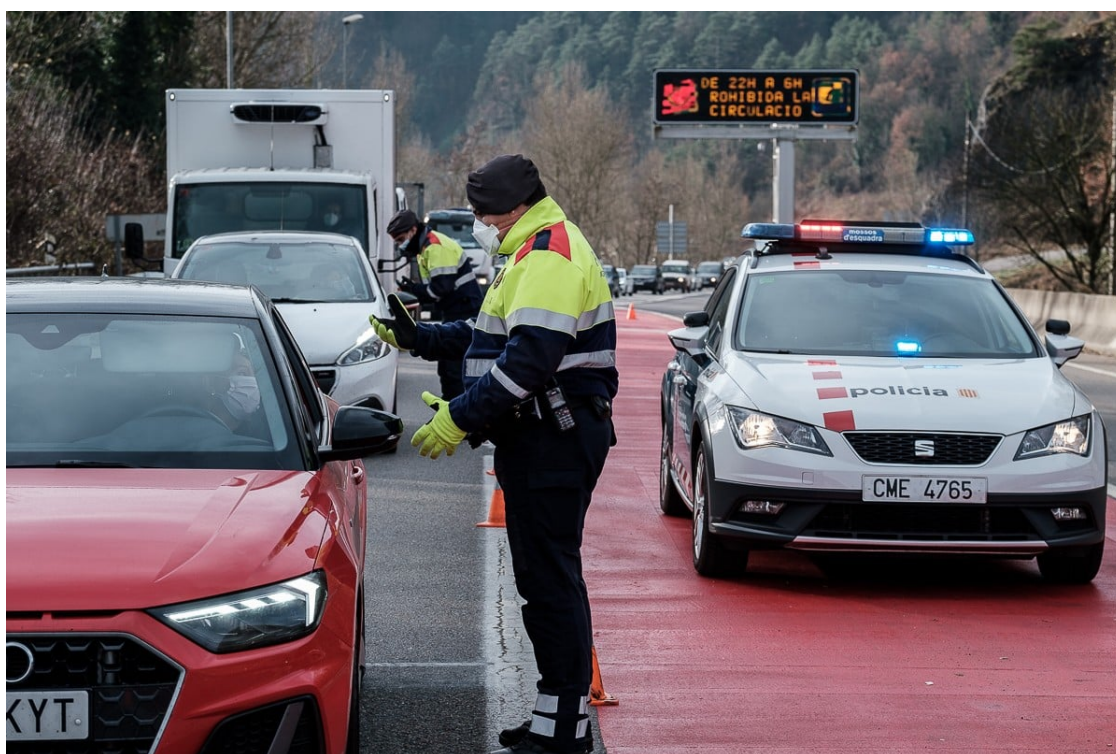
Control policials a l'entrada de Ripoll

Les restriccions arrencaran el 7 de gener, el comerç no essencial tancarà els caps de setmana i l'escola es reprendrà, com estava previst, l'11 de gener