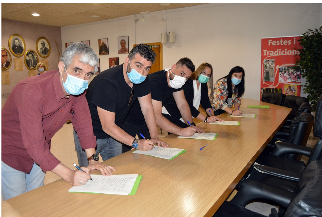
Representants dels grups municipals de Sant Vicenç signant el pacte

Es destinaran 60.000 euros en ajuts directes a professionals autònoms i comerciants i s'establirà una línia de finançament de 40.000 euros amb microcrèdits sense interès també per a pimes