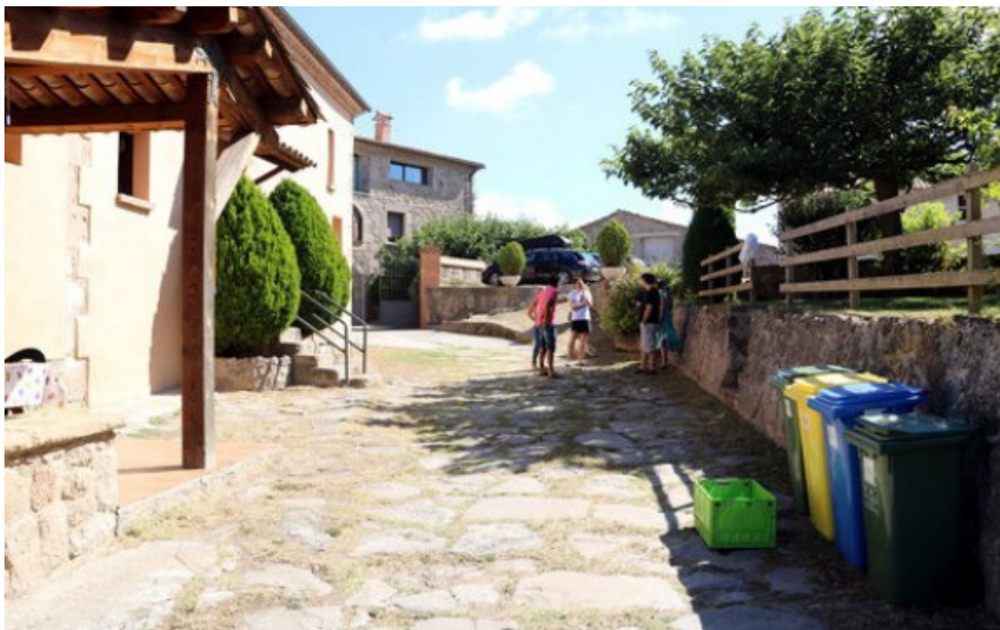
Un complex de turisme rural al Berguedà buit durant el confinament.