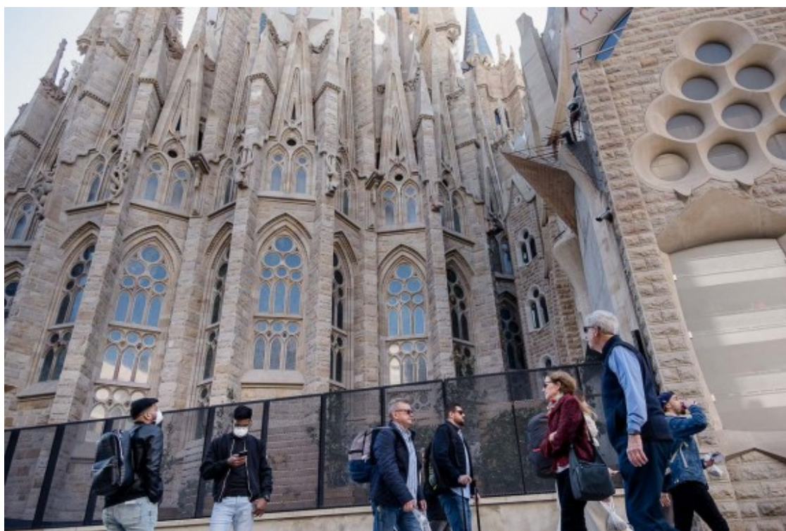
Turistes amb mascareta visitant la Sagrada Família.

Un exemple és el de la família López de Sant Cugat del Vallès, que ja tenien els vols i allotjaments pagats des de principis de febrer. Havien de marxar als Estats Units a principis d'agost però reconeixen que veuen difícil que puguin tirar endavant les vacances i tan sols esperen recuperar el màxim de la inversió possible. Ara, diuen, sense tenir res tancat i a l'expectativa de l'evolució de tot plegat, estudiaran quedar-se a Catalunya o, com a màxim, "escapar-se uns dies" a algun punt de l'Estat.