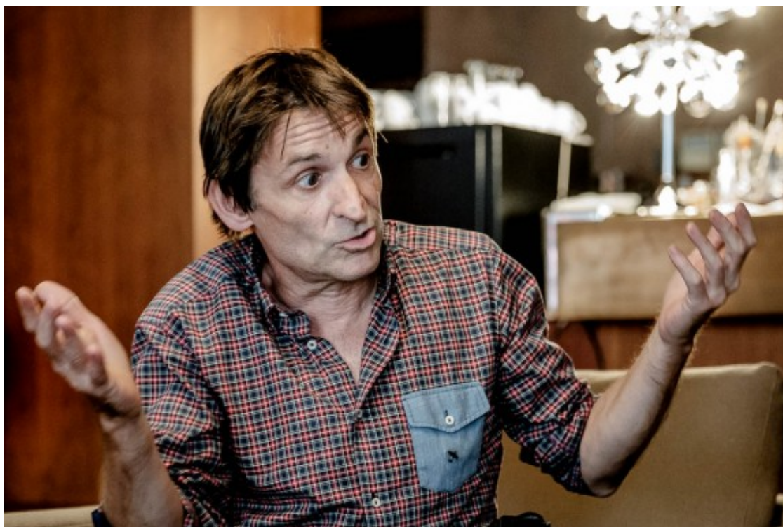
Albert Pla