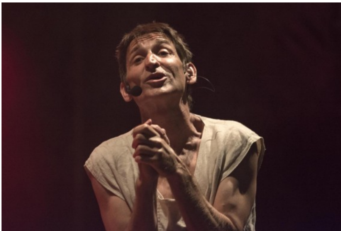
Albert Pla durant un concert.

tingut. No busco temes concrets, faig el que puc.