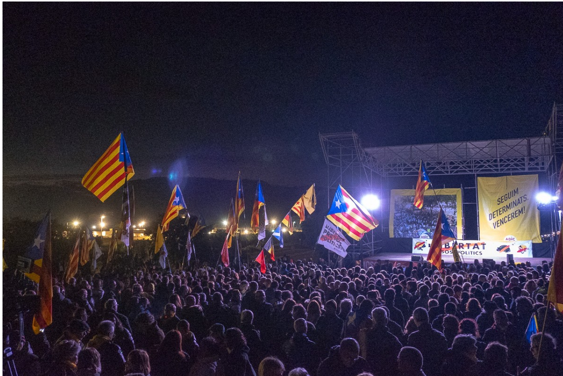
Concentració a l'exterior de Lledoners | Josep M. Montaner

El líder republicà explica en una carta que dissabte, a més de fer dos anys del seu empresonament, hi haurà familiars seus i que és l'aniversari del seu fill