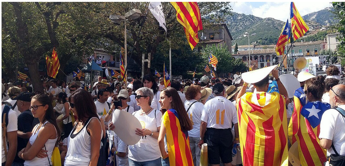
Manifestants a Berga durant la Diada de 2016 (arxiu).

El dia de sortida el punt de trobada serà a les 8 del matí a la plaça Guernica de Berga, es farà parada a Navàs per dinar i s'arribarà al vespre a Manresa