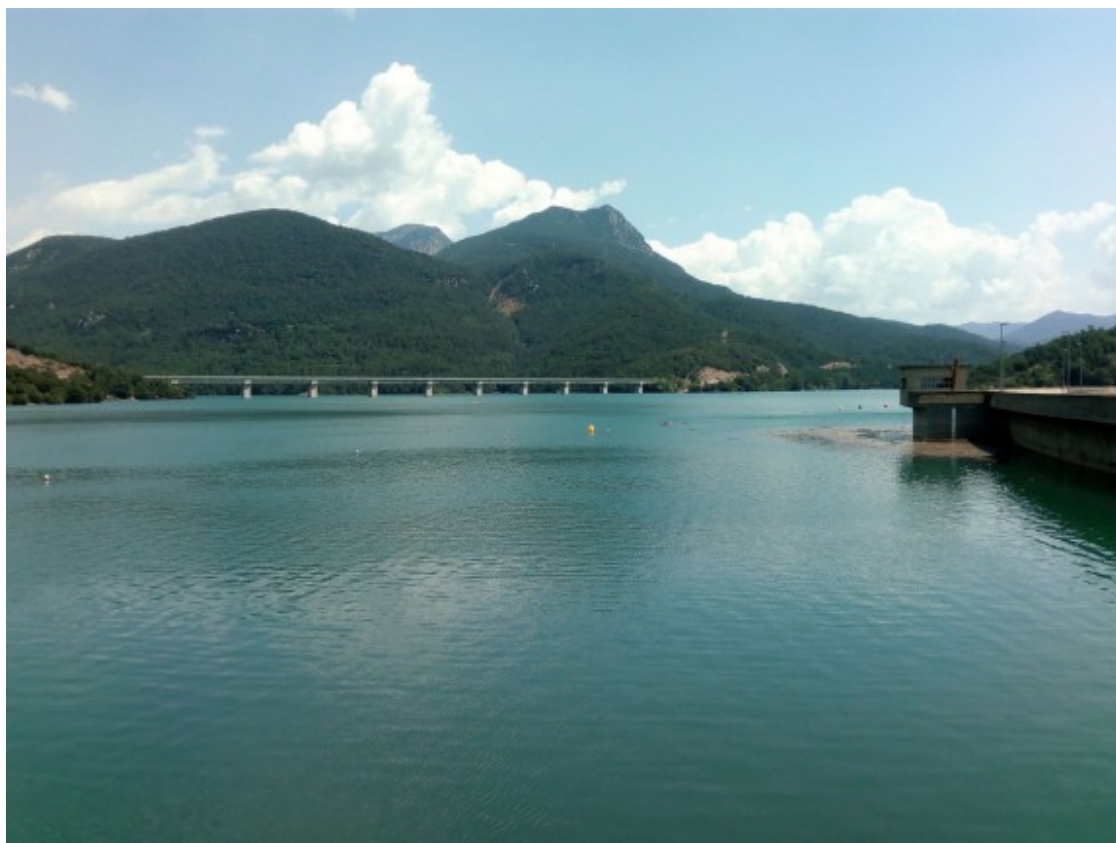
L'embassament de la Baells.

14. Pantà de la Torssa (Espot, Pallars Sobirà) ( https://www.escapadarural.cat/quefer/espot_es/pantano-de-la-torrassa )