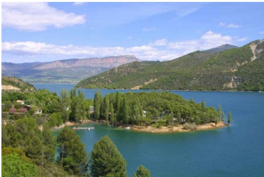
L'embassament de Sant Antoni.