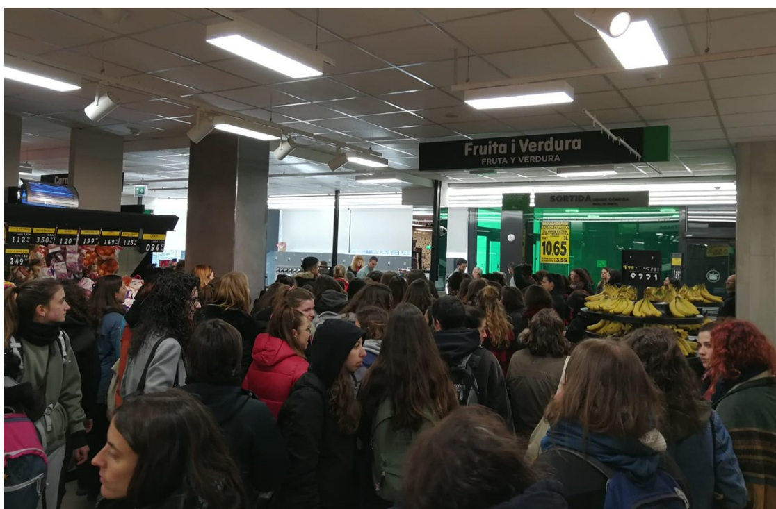
Les activistes a l'interior del Mercadona

Les activistes denuncien "empentes i cops" dels Mossos d'Esquadra a la porta de l'empresa RMT Logistics del polígon de Santa Anna