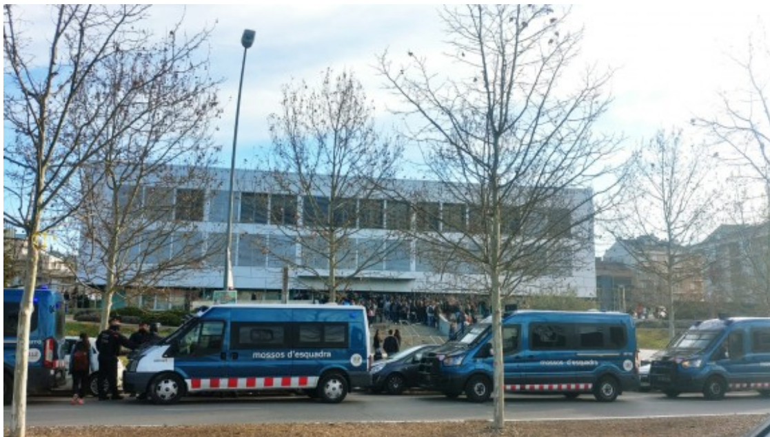
Important presència policial a la porta de la FUB, davant el piquet del 8-M.

El Comitè del 8-M de Manresa ha matinat aquest divendres per fer efectiva la vaga feminista. A partir de les 5 del matí s'han convocat a l'avinguda dels Dolors, davant de l'Stroika, i s'han dirigit fins a l'empresa RMT Logistics, del polígon de Santa Anna de Sant Fruitós per impedir l'entrada del torn de treball de les 6 del matí. Es tracta d'una empresa "molt feminitzada i amb unes condicions laborals molt precàries" han assegurat.