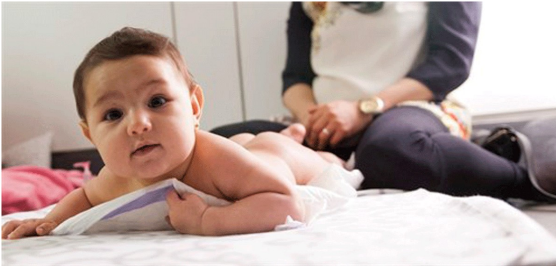
Un nadó

L'Idescat ha fet pública la llista amb els més freqüents entre els naixements