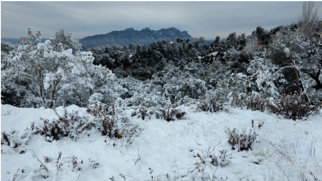
Montserrat, vista des de Vacarisses | Albert Segura

Els ruixats de neu poden caure pràcticament a nivell de mar en diversos punts a partir de dilluns al migdia fins dimecres al matí | Les precipitacions més importants de neu cauran a l'interior i al Prepirineu