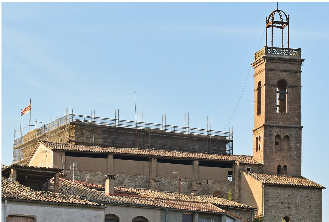
Castell del Poble Vell, amb les bastides de les obres, al costat de l'Església del Roser

També han començat les obres per a la consolidació de dues façanes del Castell