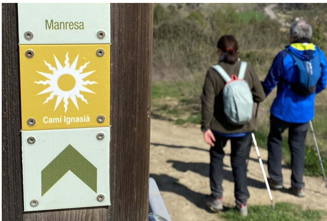
El Camí Ignasià rescata el debat sobre la poca (i cara) oferta d'allotjament a Manresa | AjM

Tot i que la valoració de l'evolució del projecte Manresa 2022 és bona i està portant més turisme a la ciutat, tant l'Ajuntament com els jesuïtes de la Cova són conscients que perquè tot plegat es consolidi, falten recursos i temps