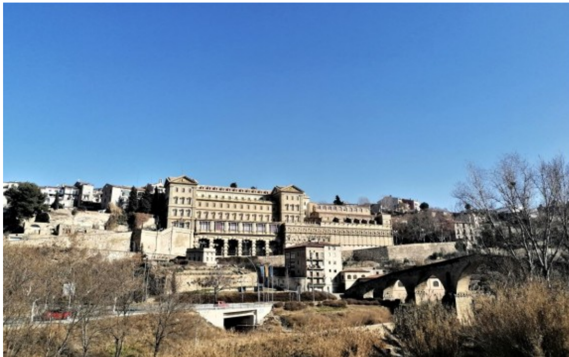
La Cova de Manresa

A Manresa, però, l' alberg és "com si no hi fos" , es queixa Calmet: "fa vuit anys que en reclamo la gestió a la Generalitat , i de moment, res de res". Pel que fa a la Cova, la capacitat total que té és de 90 hostes, "i aquí hi hem de comptar tota la gent que ve a la Casa d'Exercicis Espirituals a fer retirs, que és molta", constata Iriberrí. Això vol dir, doncs, que el nombre de pelegrins que hi poden allotjar, "és força limitat ". I "és una pena", diu, "perquè després dels dos anys de pandèmia en què tot va quedar parat, ara la gent té moltes ganes de fer activitats d'aquest tipus". Davant d'aquesta situació, és contundent: "si volem que el nombre de pelegrins augmenti, el que hem de fer és publicitar el camí i assegurar-nos que els serveis que s'hi ofereixen són suficients ". I això passa "per demanar a l' administració pública que ens doni un cop de mà a nivell de màrqueting ".