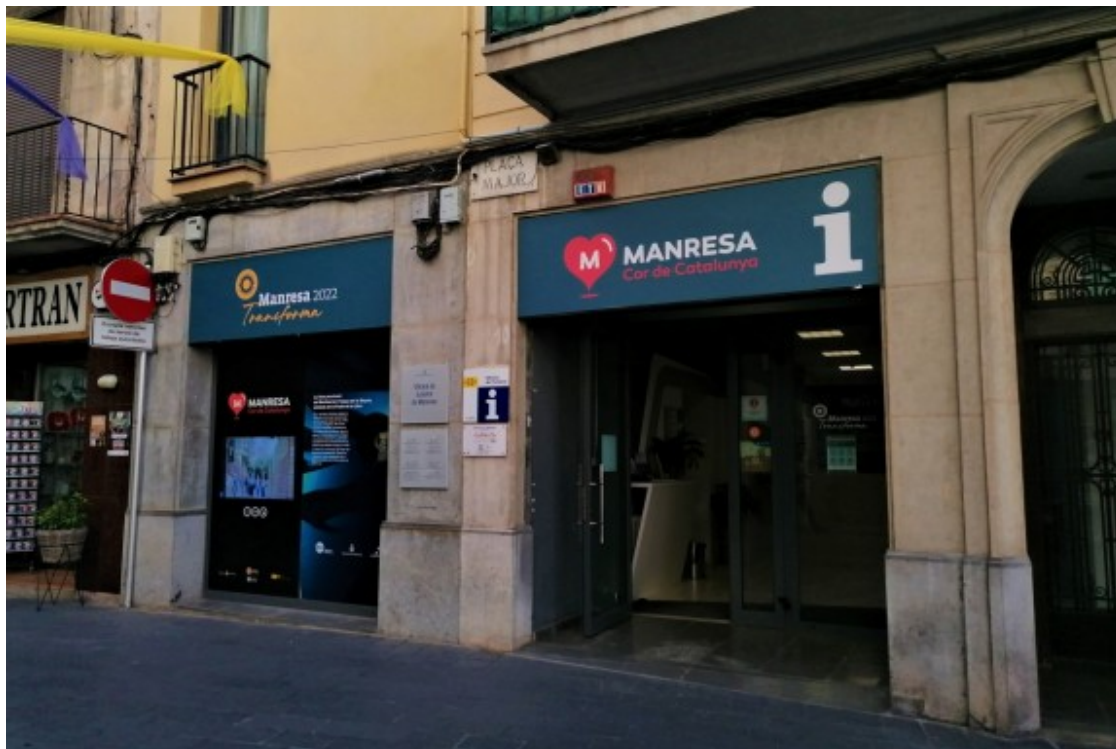
Entrada de l'Oficina de Turisme de Manresa

Certament, les xifres així ho demostren: amb el que portem d'any, ja han passat per l'Oficina de Turisme manresana 14.204 persones . Si els sis mesos que queden la dinàmica segueix sent la mateixa, s'acabarà el 2022 amb pràcticament un 40% més de visitants que el 2019. I tot fa pensar que els trets aniran per aquí: "l' allotjament que tenim a la ciutat (pisos turístics, apartaments i hotels) està ple fins a finals d'any", celebra el regidor.