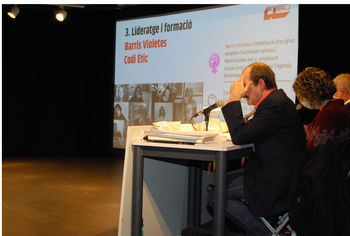
Assemblea de la CONFAVC, aquest dissabte a Manresa | CONFAVC

La CONFAVC ha celebrat aquest dissabte la 37a Assemblea de les Associacions Veïnals de Catalunya a la capital del Bages