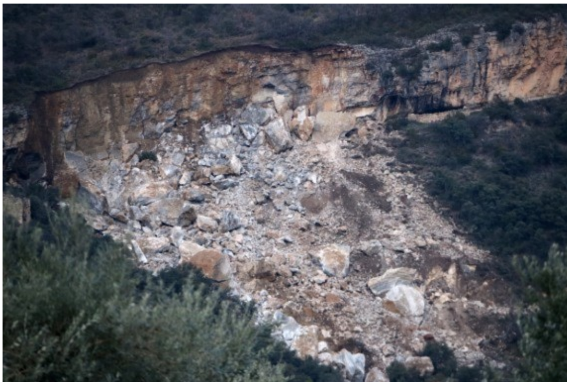
Imatge de la gran esllavissada de l'any 2018 prop de Moror.