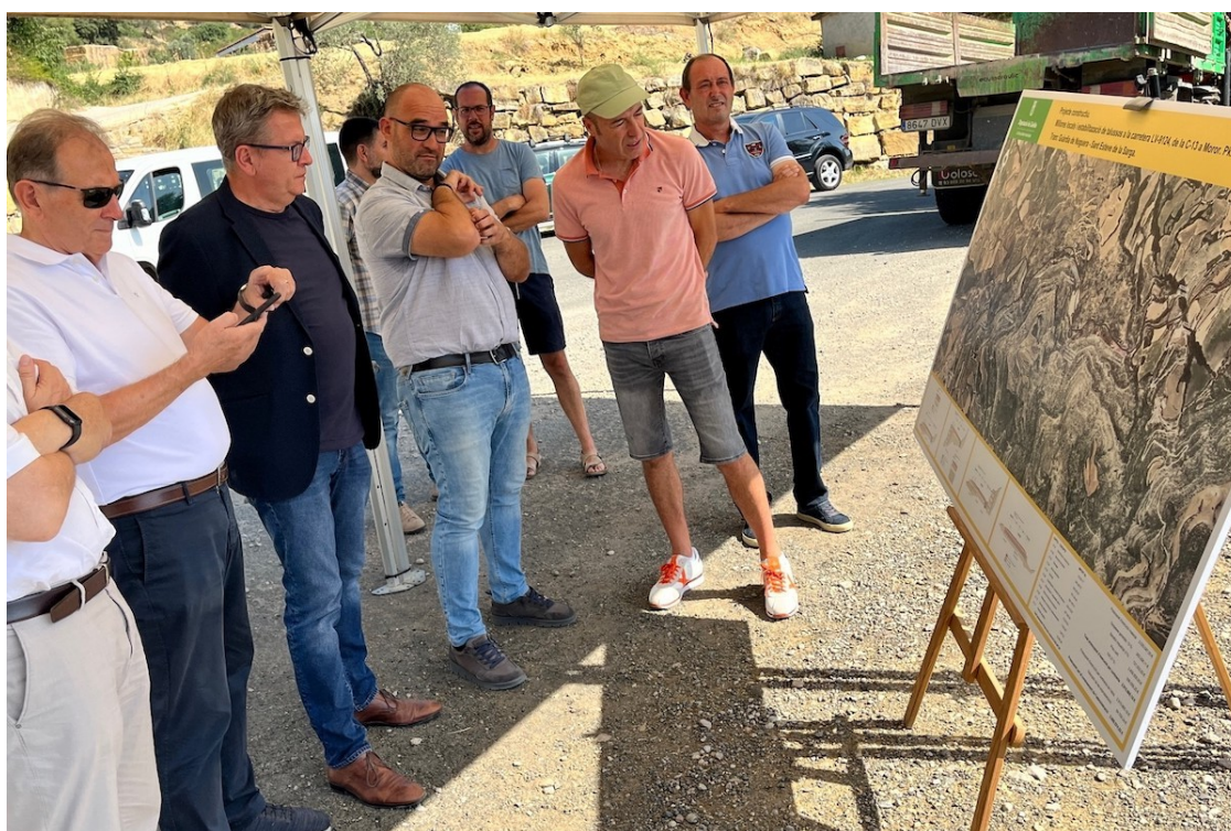
Els diversos representants locals durant la presentació del projecte a Moror

El projecte, que contempla una inversió de 3 milions d'euros i un període d'execució de 18 mesos, s'ha presentat aquest dimarts des de Moror