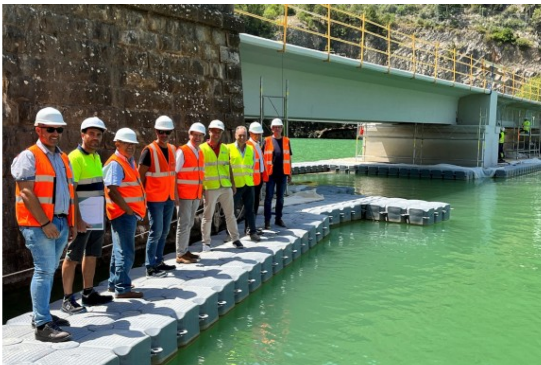
Al pont de Monarés, a Llimiana, s'hi estan realitzant obres de reparació.

Es tracta de la rehabilitació del pont, inclosa l' adequació de la plataforma per habilitar l'ancoratge sobre el tauler amb suficients garanties d'un sistema de contenció, i per generar un espai addicional suficient per al pas de vianants . Una rehabilitació que permetrà també validar l'ús del tauler per a càrregues majors a les de la normativa vigent en el moment del seu projecte, molt més semblants a les normatives d'accions actuals.