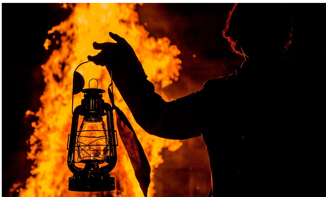
Una foguera de Sant Joan | Adrià Costa

La festivitat va néixer per celebrar el solstici d'estiu i purificar persones i camps, però el cristianisme va acabar fent-se-la seva