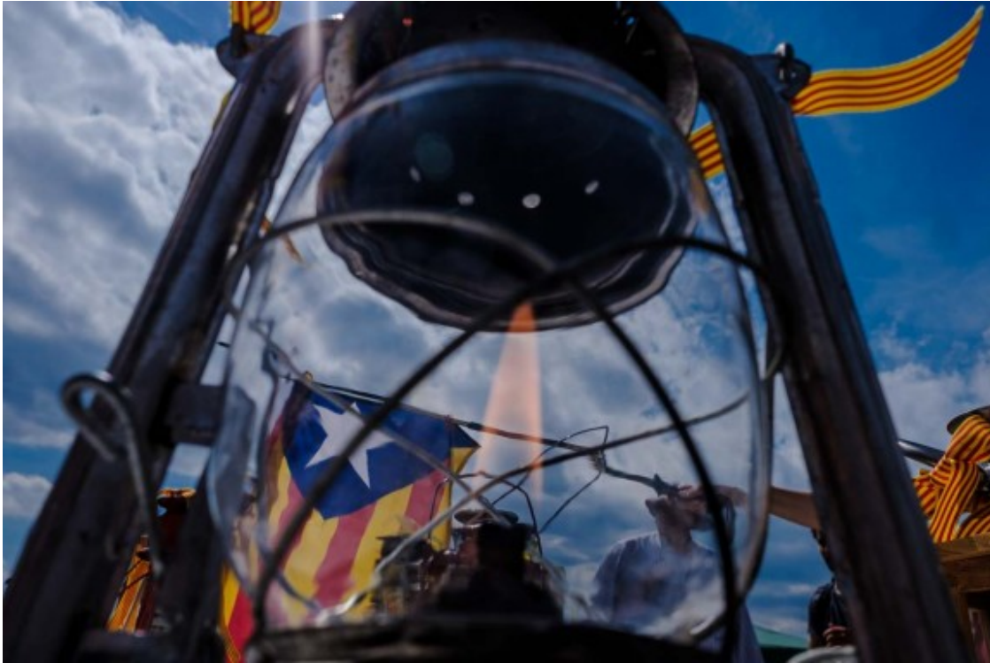
Arribada de la Flama del Canigó a Coll d'Ares.

No obstant, l'arrelament d'aquesta tradició per part de la societat catalana va acabar per fer acotar les voluntats combatives del clergat, que va acceptar les enceses com un costum que, si bé era d'origen pagà, havia estat assumit com una tradició que marcava l'inici d'un temps nou i que tampoc suposava una amenaça contra els dogmes de la fe.