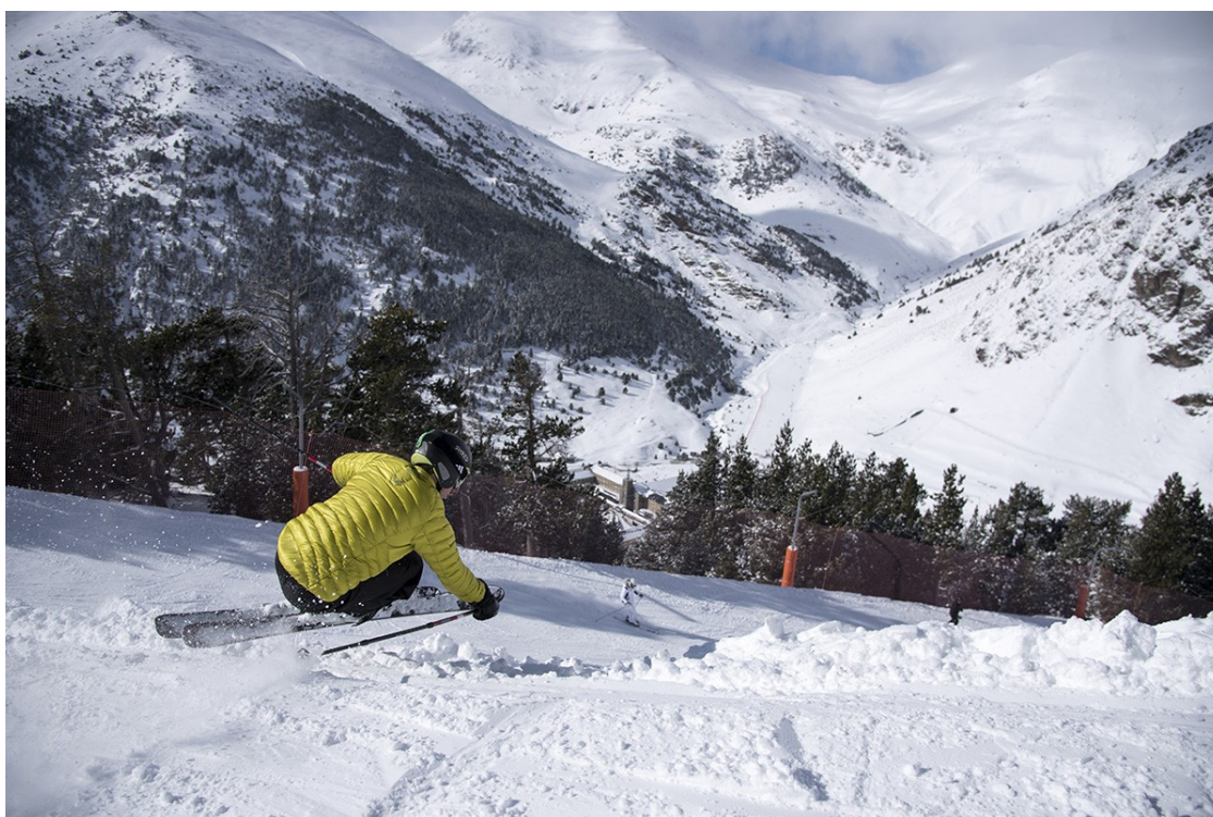
Un esquiador a la Vall de Núria

La venda de forfets es farà exclusivament online i de forma anticipada per evitar les aglomeracions