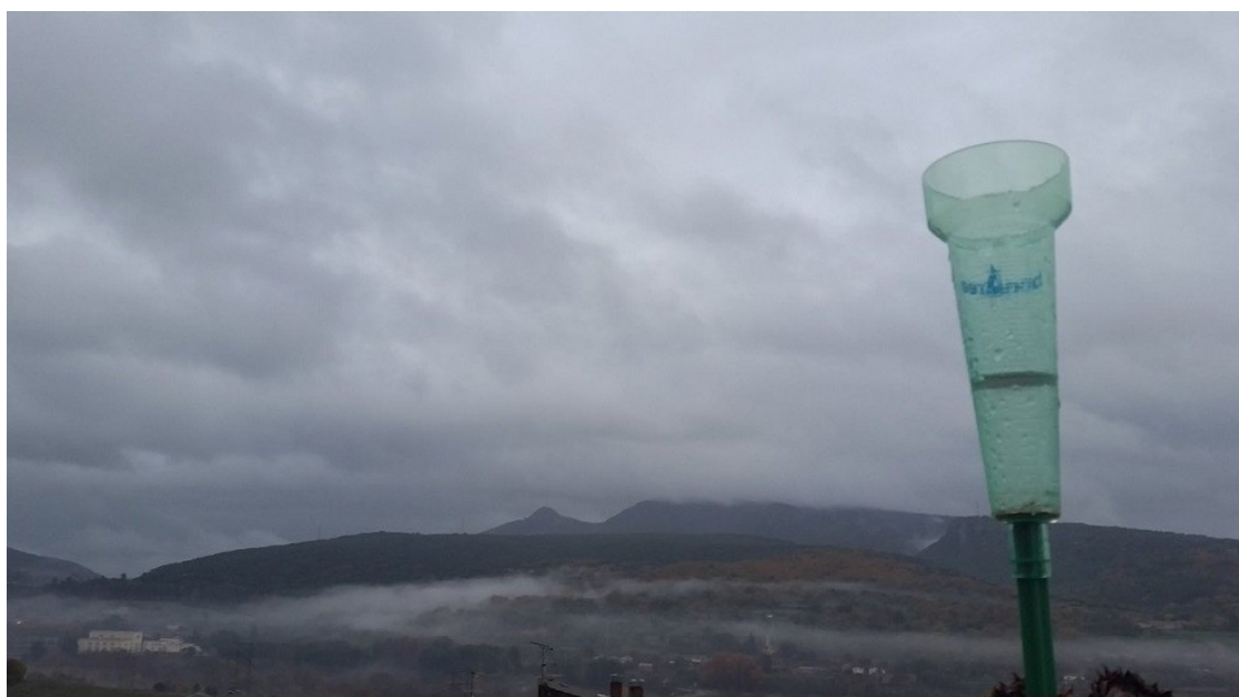
La Conca de Tremp sota la pluja | Jordi Peró

El Servei Meteorològic de Catalunya adverteix que es pot donar la condició que es formi un petit cicló quasi tropical