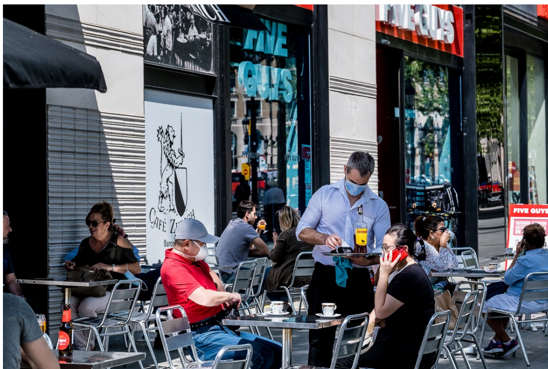
Una terrassa durant la fase 1 a Barcelona

El Departament de Salut sol·licita també el canvi a fase 3 de Terres de l'Ebre, Camp de Tarragona i Alt Pirineu-Aran i que Barcelona i les regions metropolitanes passin a la fase 2