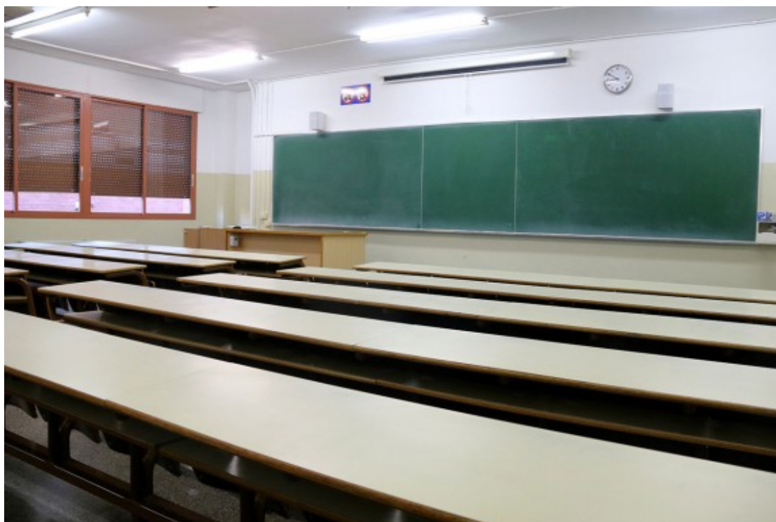
Les metodologies tradicionals segueixen sent predominants a les universitats.

Finalment, l'estudi també conclou que només el 5% de les metodologies són innovadores, malgrat ser en plena revolució digital. Quines són aquestes metodologies? Ariño explica que són, per exemple, les classes inverses, classes semipresencials, simulacions... En altres paraules, el 65% de les classes continuen sent amb la metodologia tradicional: classes magistrals, avaluació final i exàmens escrits. Només un 30% fan servir metodologies actives (participació de l'alumnat, treballs en grup, avaluació contínua...).