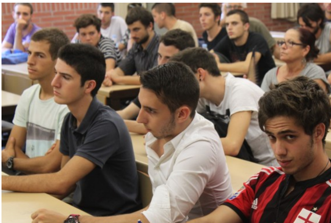
Alumnes de la facultat d'economia de la UB

Ariño apunta que en les titulacions més masculinitzades les dones tenen una pitjor percepció de les capacitats pròpies i del reconeixement extern, el que anomena "la síndrome de la impostora". Segons Ariño, "les dones tenen la sensació que ascendeixen quan entren en un àmbit masculí, se senten intruses per estar en un sector que no senten seu i es culpabilitzen".