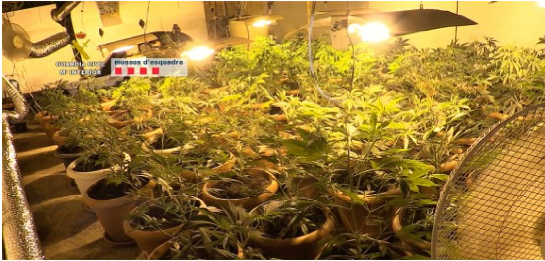
Una plantació de marihuana comissada.