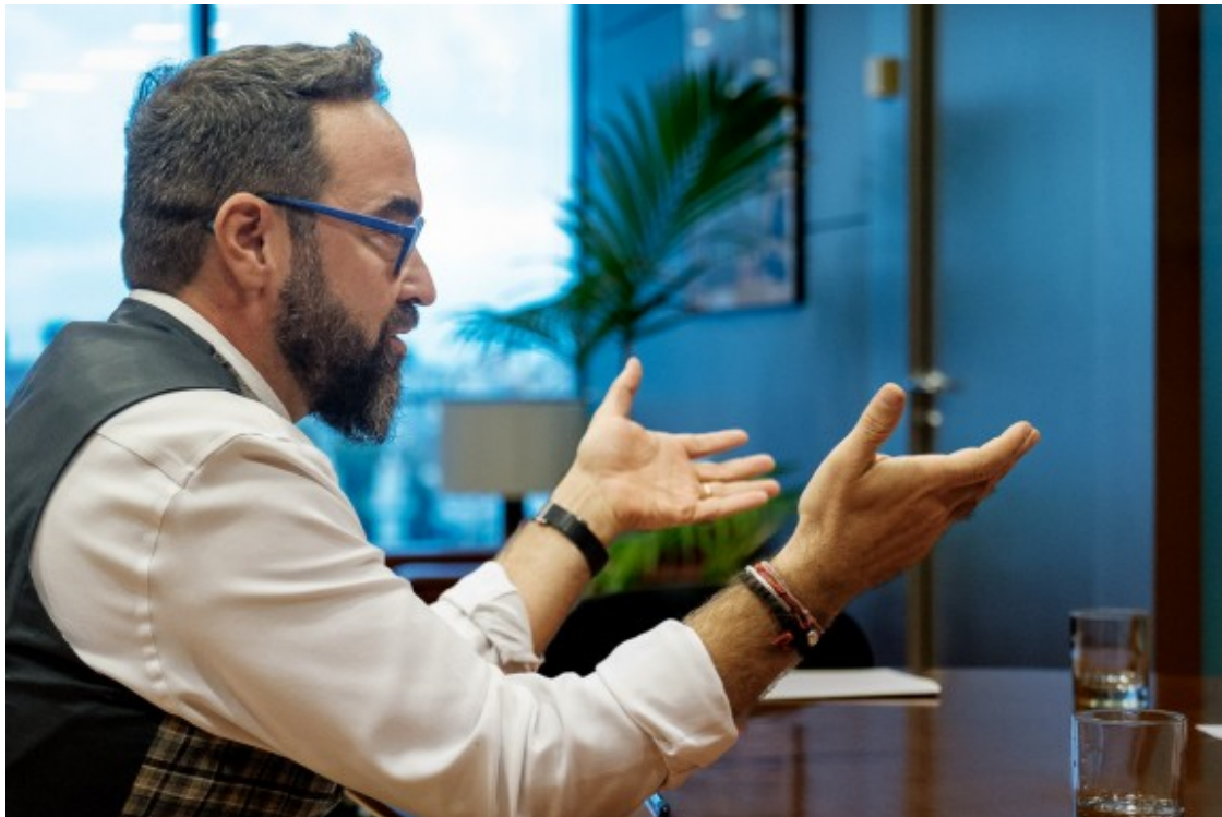
El conseller de Territori, al despatx del Departament.

- El Govern el que creu és que les polítiques excepcionals sobre els preus les hem de fer de manera coordinada i cooperativa, i és així com s'ha de treballar, no amb anuncis de part. I sempre tenir present el que els explicava respecte l'equilibri entre la viabilitat del sistema públic i les necessitats de la gent.