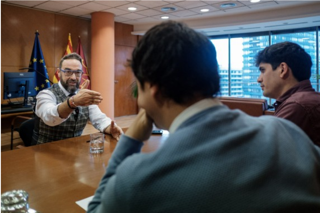
El conseller de Territori, durant la conversa amb NacióDigital.

- Per entendre'ns. Després de l'acord per la reforma del codi penal, el següent acord prioritari és pel traspàs de Rodalies?