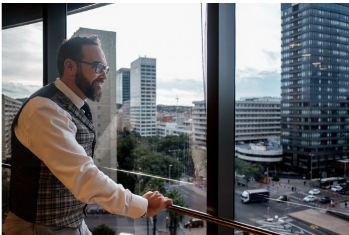
El conseller de Territori, al despatx de la setena planta del Departament.

- Sí les dades són així, no haurien de ser-ho. Desconec perquè a Barcelona ha passat això i, si està passant, veurem com ho solucionem. I sobre els judicis de valor, penso que tothom davant l'habitatge ha intentat fer tot el que pot: la Generalitat, els ajuntaments i segur que l'Estat a la seva manera també. El que hem d'intentar és alinear-nos i incrementar recursos en habitatge de lloguer social, en creació de parc públic i emergència. En aquests casos d'urgència habitacional, la Generalitat ha fet una aposta per complementar el programa del bo jove de l'Estat. Aquests esforços que fem tots s'han de posar en valor i hem d'intentar trobar estratègies positives.