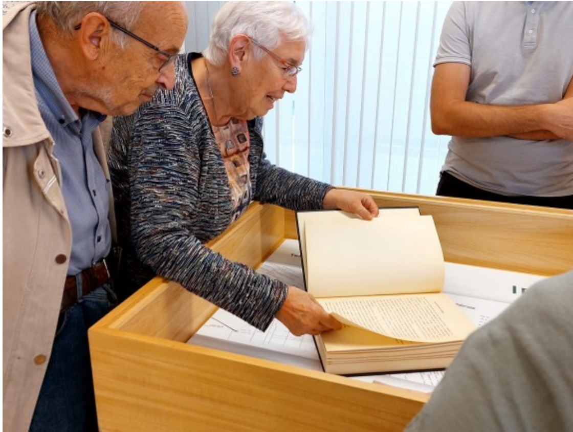
Encuriosits fullejant el llibre