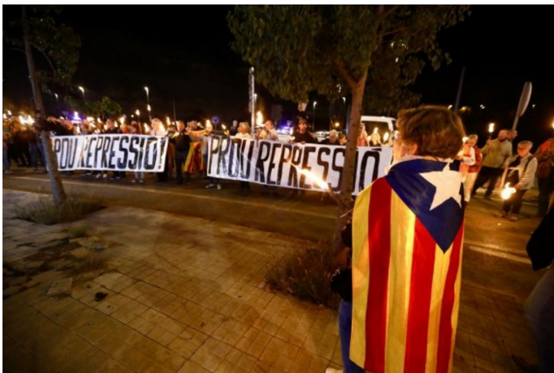
La mobilització amb les dues pancartes, de Sabadell i Terrassa

Crits i proclames contra la policia catalana i per la independència. Els portaveus de les dues organitzacions han carregat contra els agents que han " colpejat contra el seu propi poble ", després de la jornada de l'1-O, quan aleshores van mostrar un comportament "mesurat i democràtic". Per això, els han instat que es posi " al servei " de la gent i "no protegeixi la ultradreta i carregui contra independentistes i antifeixistes".