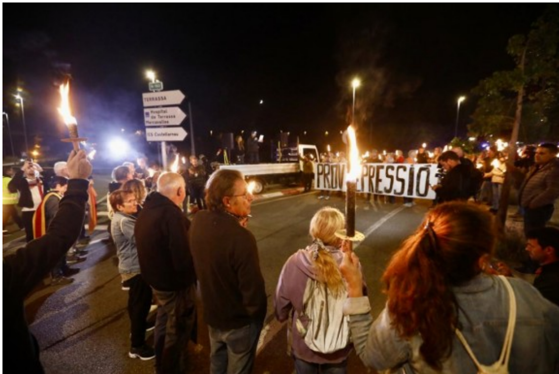
Les torxes, protagonistes