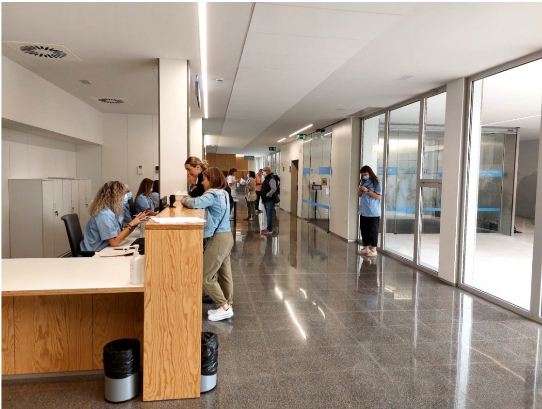
Una consulta del nou CAP Can Roca

El 3 d'octubre l'esperat centre d'atenció primària Can Roca obrirà les seves portes, preparat per atendre els gairebé 24.000 pacients procedents del CAP Rambla i del CAP Nord