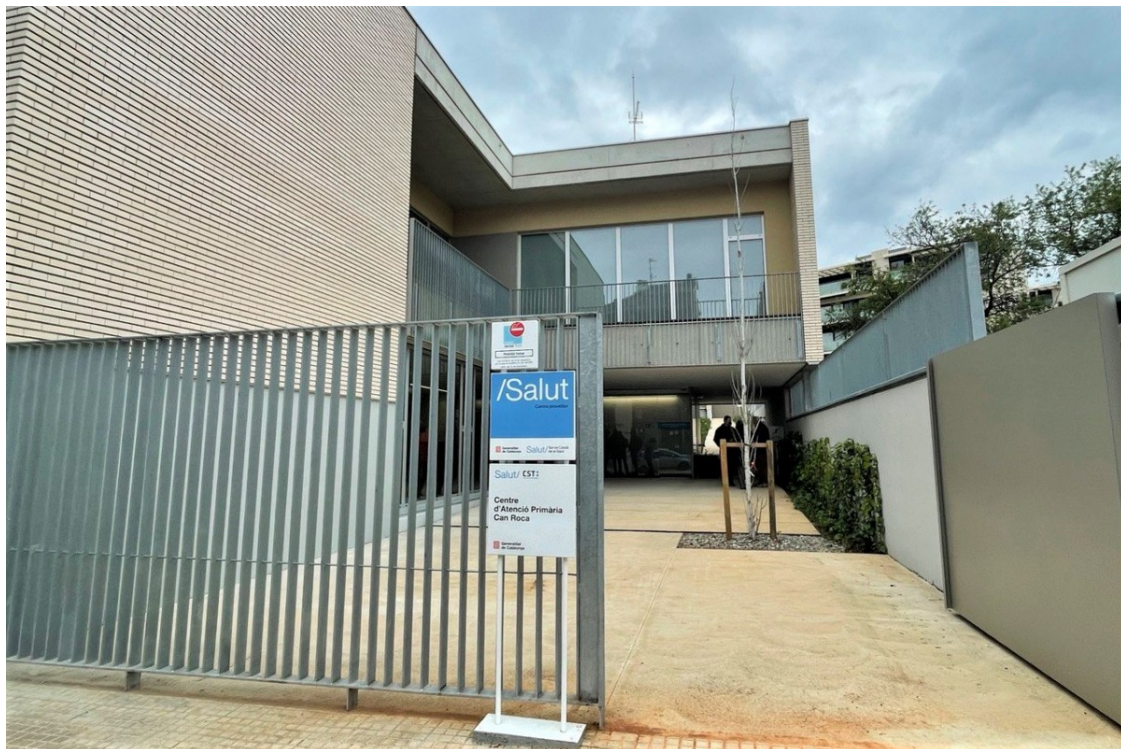
CAP Can Roca de Terrassa. | Anna Mira

El nou centre sanitari acollirà gairebé 24.000 persones procedents del CAP Rambla i del CAP Terrassa Nord