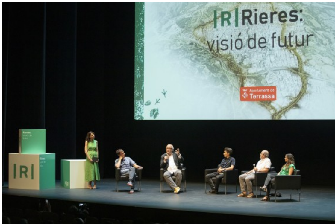
Acte sobre les rieres de Terrassa.

En aquest sentit, l'Ajuntament ha fet dos projectes per demanar 9 milions d'euros a la convocatòria de fons europeus Next Generation , amb l'objectiu de renaturalització d'un tram de la riera de les Arenes , entre el pont de Béjar i el Pont de Sant Llorenç, a la carretera de Castellar, i la renaturalització d'un tram de la riera del Palau , entre el Pont de les Arts, a l'avinguda Béjar, i pont de l'avinguda de l'Abat Marçet.