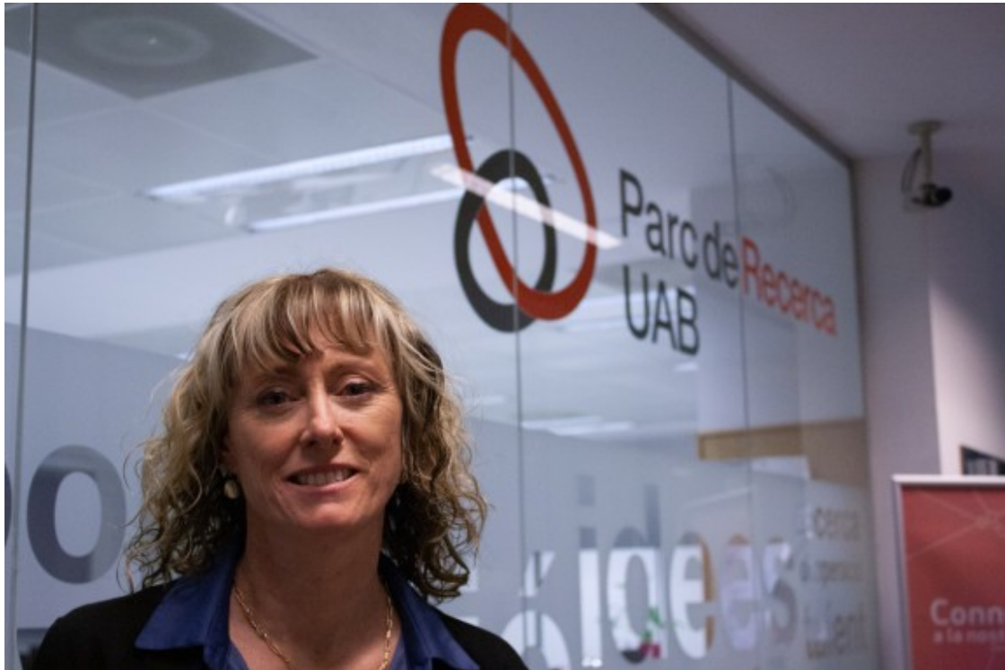
La directora apunta que el coronavirus ha canviat la perspectiva de la recerca.