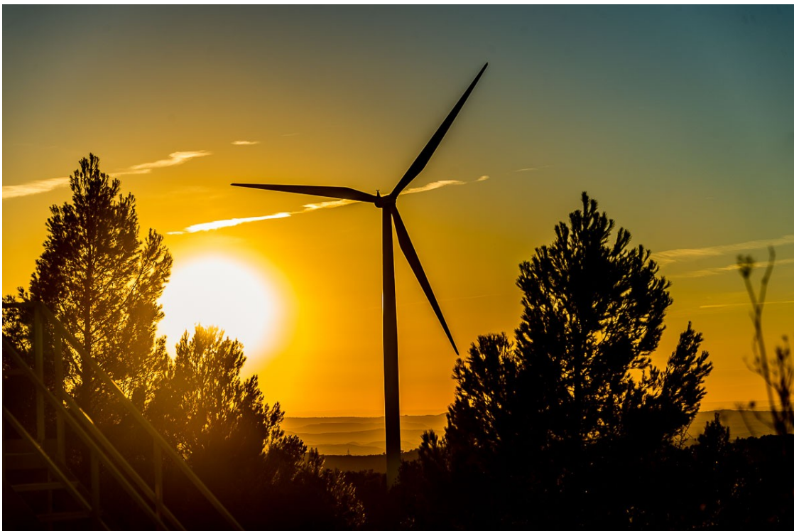
Un aerogenerador a Catalunya | Josep M. Montaner

La Generalitat accelera la implantació per complir amb la llei del canvi climàtic i topa amb alcaldes i ambientòlegs, que alerten del greuge a la Catalunya Nova