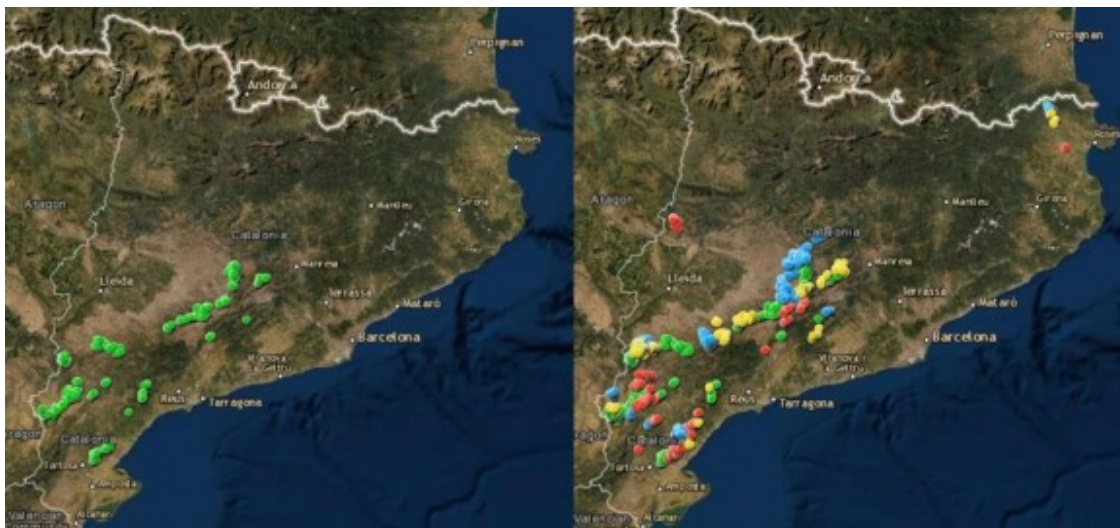
El mapa eòlic del 2020 i els projectes de parcs per als pròxims anys

( http://mediambient.gencat.cat/ca/05_ambits_dactuacio/avaluacio_ambiental/energia_eolica/visor/ ) , a Catalunya hi ha ara 45 parcs eòlics on funcionen 811 aerogeneradors, una xifra que s'ampliarà previsiblement ( https://www.naciodigital.cat/lleida/noticia/41787/macroprojecte-cinc-parcs-eolics-entre-segria-ribera-ebre-avalat-generalitat ) després que la ponència d'energies renovables, l'òrgan col·legiat integrat per representants de diferents departaments de la Generalitat amb competències en medi ambient, energia i urbanisme, hagi segellat la viabilitat de 9 nous parcs i de 257 molins més. Fent l'equivalència en potència eòlica, dels 1.271 megawatts actuals s'hauria de passar a 4.000 d'aquí deu anys i a 12.000 el 2050, any que també s'assoliran 37.000 megawatts d'energia fotovoltaica.