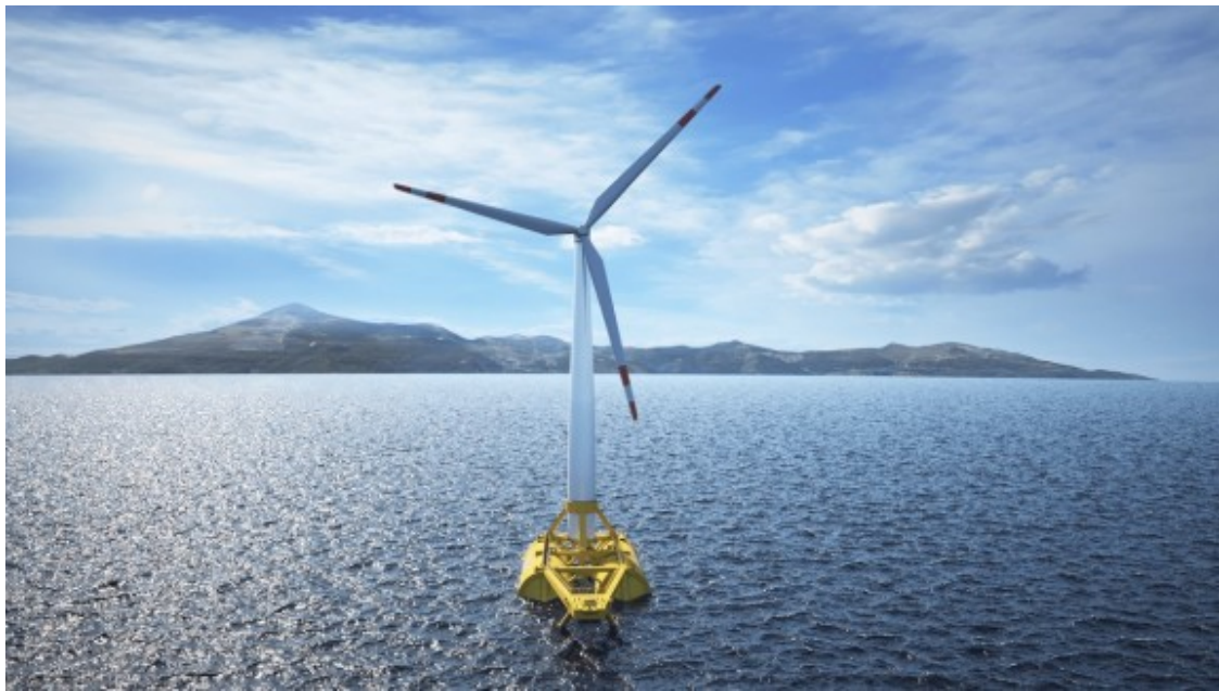
Un molí eòlic davant de la costa.

Una altra alternativa als molins del paisatge rural és la instal·lació en polígons industrials. Aquesta pràctica no és habitual a Catalunya perquè, segons Saladié, "no hi ha interès a fomentar-la". El sòl dels polígons és més car que el de molts turons, de manera que les empreses no veuen amb bons ulls la inversió en maquinària d'energia renovable en aquests espais.