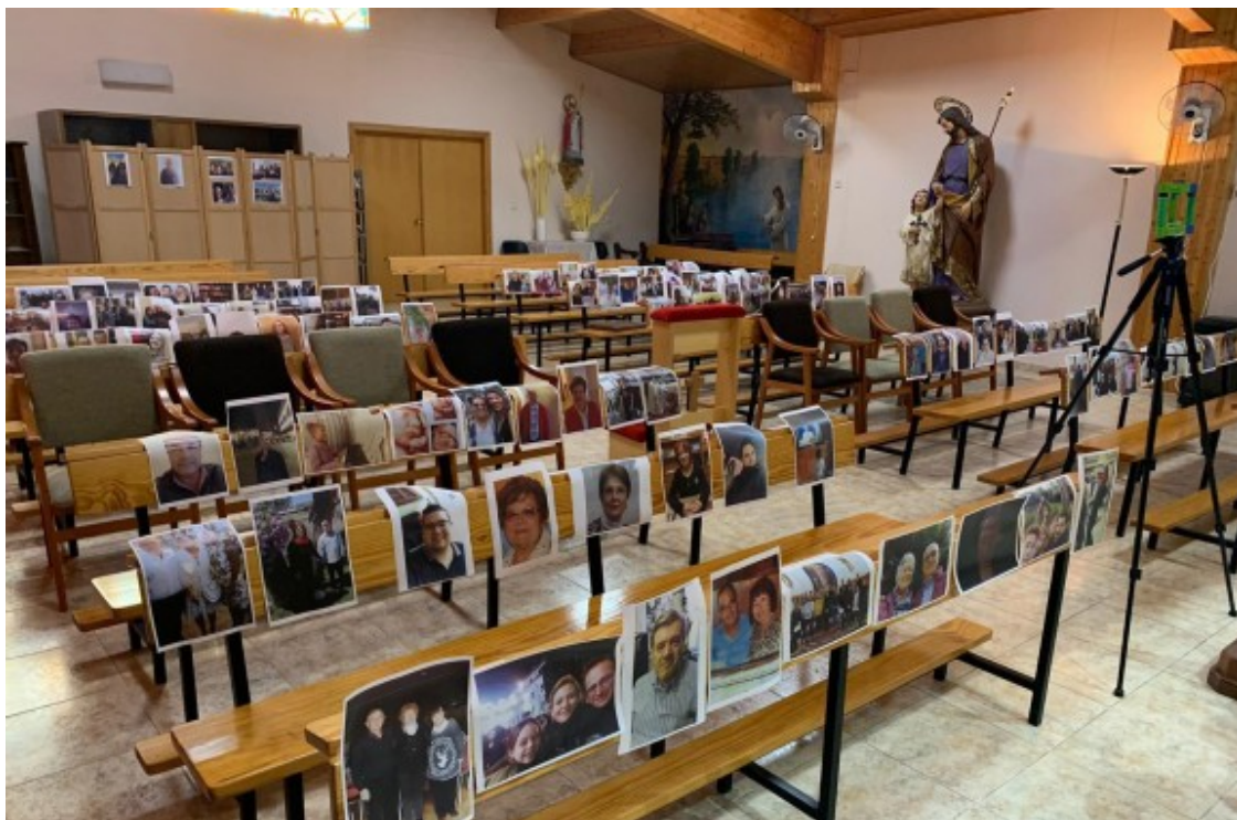
Les imatges dels feligresos sobre els bans de la parròquia Sant Miquel de la Cava.