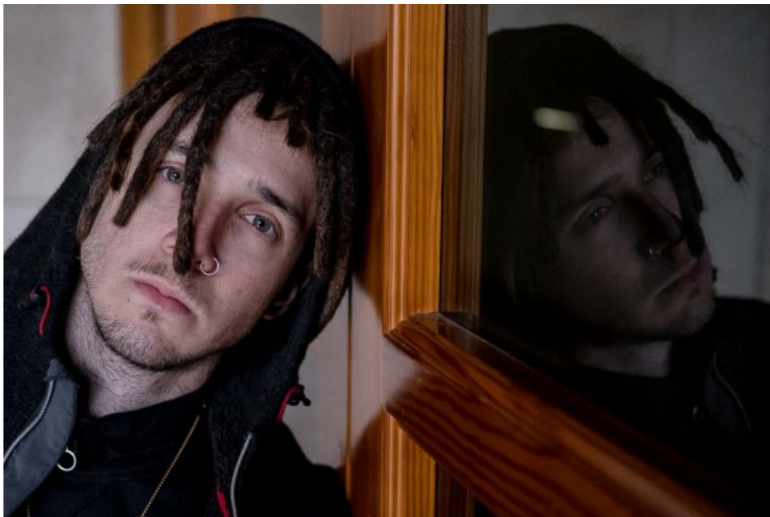
Lildami lidera el gènere urbà en català .

- Estem encantats de donar veu a grups consolidats com P.A.W.N Gang ( https://www.youtube.com/channel/UCK3HgaeRNO-5mJkqvyB1hBA ) o 31 Fam ( https://www.youtube.com/channel/UC9X30uS2tBqnVwEqpmA32xQ ), però també a grups i artistes emergents de l'escena urbana catalana, com Lil Russia ( https://www.youtube.com/channel/UCrNYZRF2JTjADwzbGRs-3mQ ). Així i tot, també vindran artistes internacionals i creiem que tot plegat convergirà en una mescla potent, fent d'altaveu als grups d'aquí però sense tancar les portes a grups estrangers ( https://www.maleducats.com/artistes ).