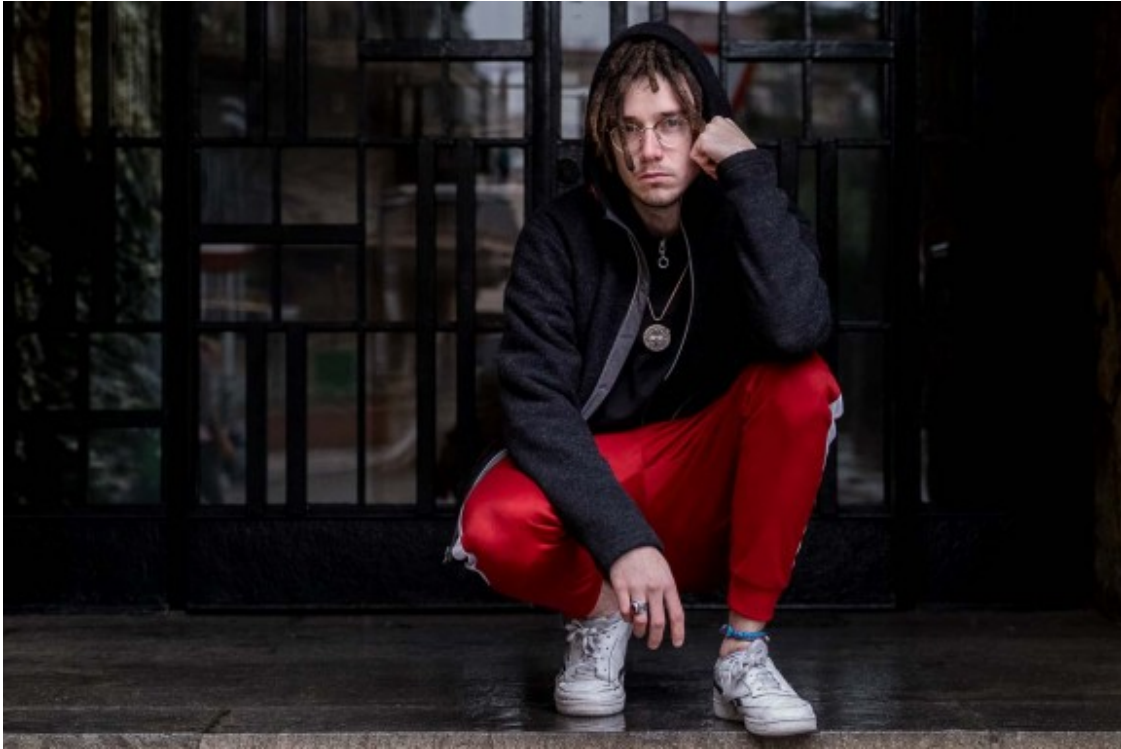
El cantant egarenc aquest dimarts a Terrassa.