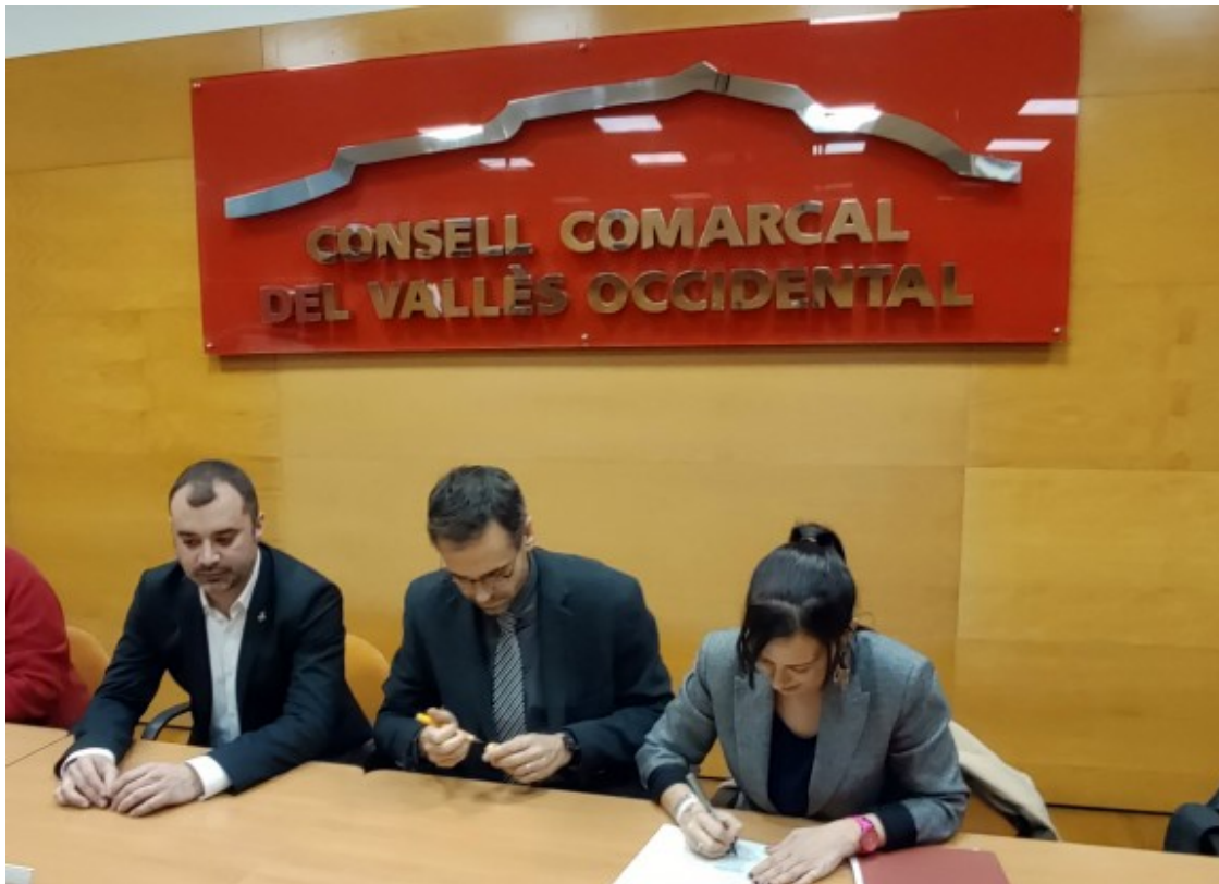
La signatura de la carta enviada al conseller

L'alcalde egarenc ha recordat que en el Pla d'infraestructures ferroviàries de Rodalies de Barcelona 2008-2015 es "contemplava com la millor opció per connectar" amb l'aeroport l'extensió de l'R4. Giménez ha afegit que es tracta d'una proposta "més ràpida, barata i eficient", a més, també ha de servir per "millorar les expedicions" a Vacarisses i Viladecavalls.