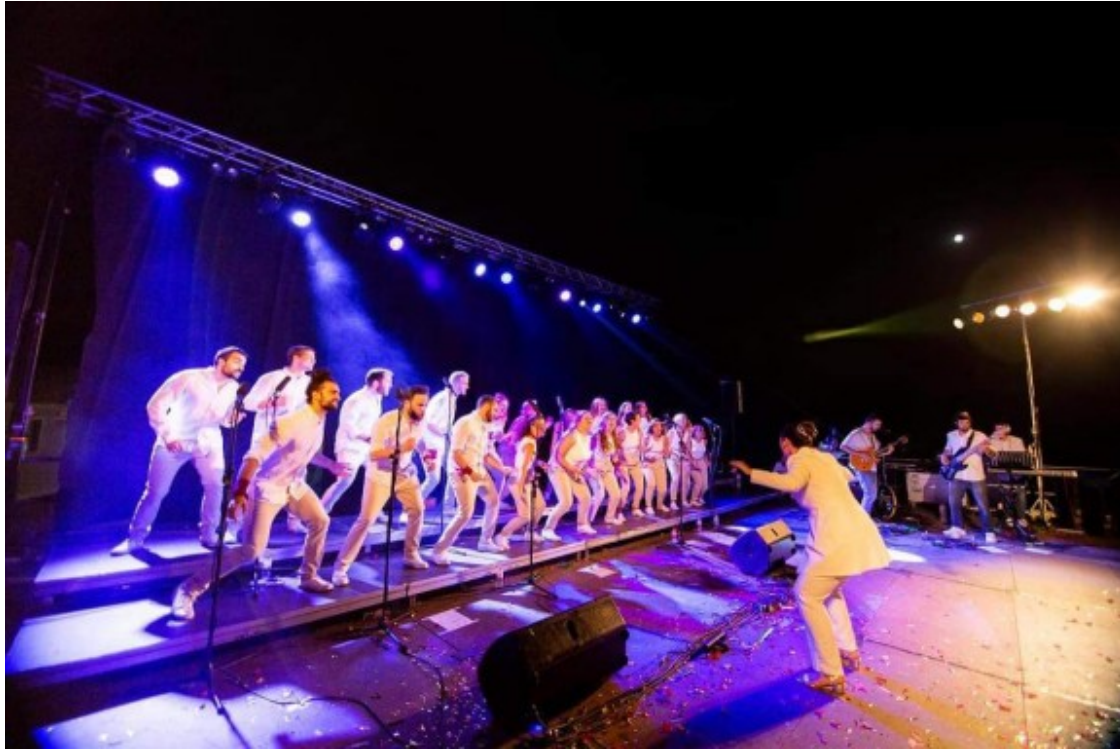
Singfònics en acció.

- El grup ha estat una coral "del segle XXI". De portes en fora, ha estat una coral que donava molta importància a la coreografia, amb una performance molt juvenil i sobretot, molt enèrgica. De portes cap endins, hem evolucionat molt, passant de peces simples a obres molt més complexes, tenint en compte que tots els seus membres eren amateurs.