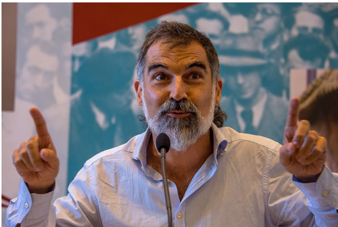
Jordi Cuixart en una imatge d'arxiu

El president d'Òmnium recomana "regar les relacions" per no reproduir xocs com els dels pactes postelectorals i sosté que el comportament de Sánchez amb Catalunya s'explica perquè sap que a Espanya "no el penalitzarà"