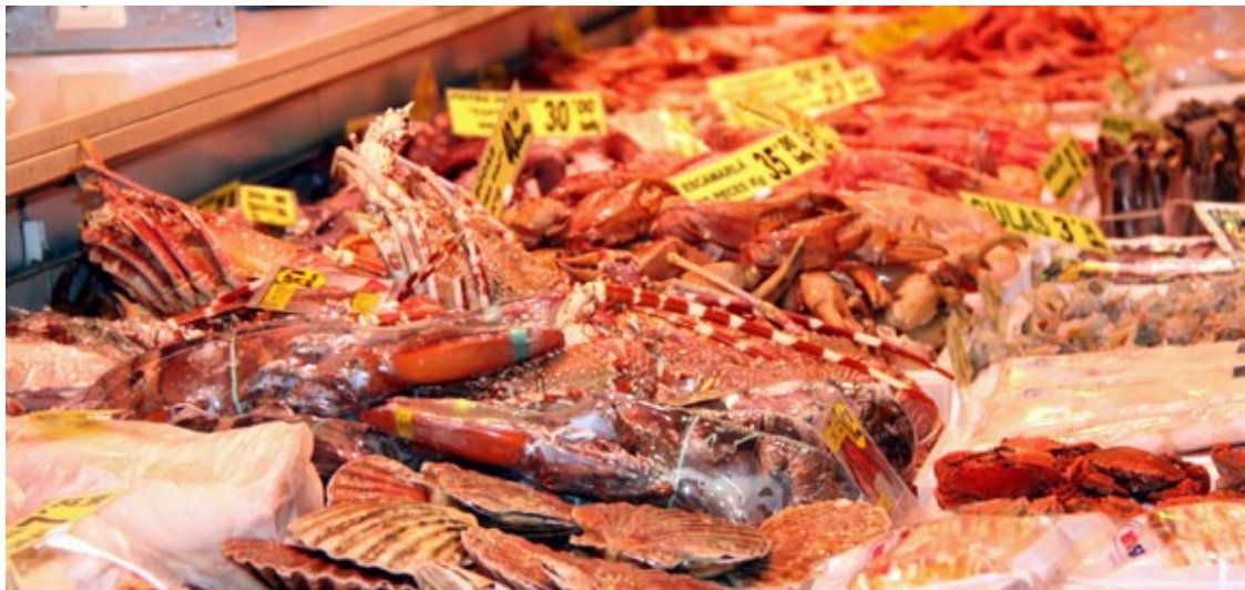
El marisc, l'escollit per acomiadar l'any.

Ara bé, el lluç no és el que més s'apuja de preu. El producte que lidera el rànquing de l'OCU són els anomenats percebes gallegos , amb una pujada de fins al 44% en molts casos. També pateixen un augment considerable en els darrers 15 dies les cloïsses (7%) i el besuc (8%).