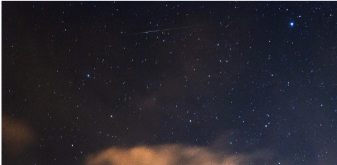
Les llàgrimes de Sant Llorenç vistes des de Malla.

? Anna Garnatxe (@AnnaGarni) 13 d'agost de 2018 ( https://twitter.com/AnnaGarni/status/1028971930571833344?ref_src=twsrc%5Etfw )