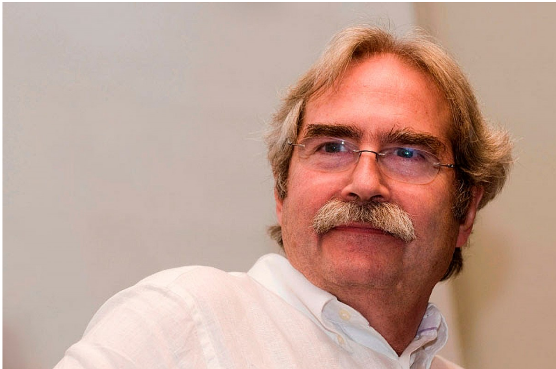
Jaume Cabré | Editorial Proa

L'escriptor, un referent de la literatura catalana contemporània, publicarà el 5 d'abril ?Quan arriba la penombra?, un conjunt de relats colpidors i plens de passió | Els seus llibres es poden llegir en 30 llengües