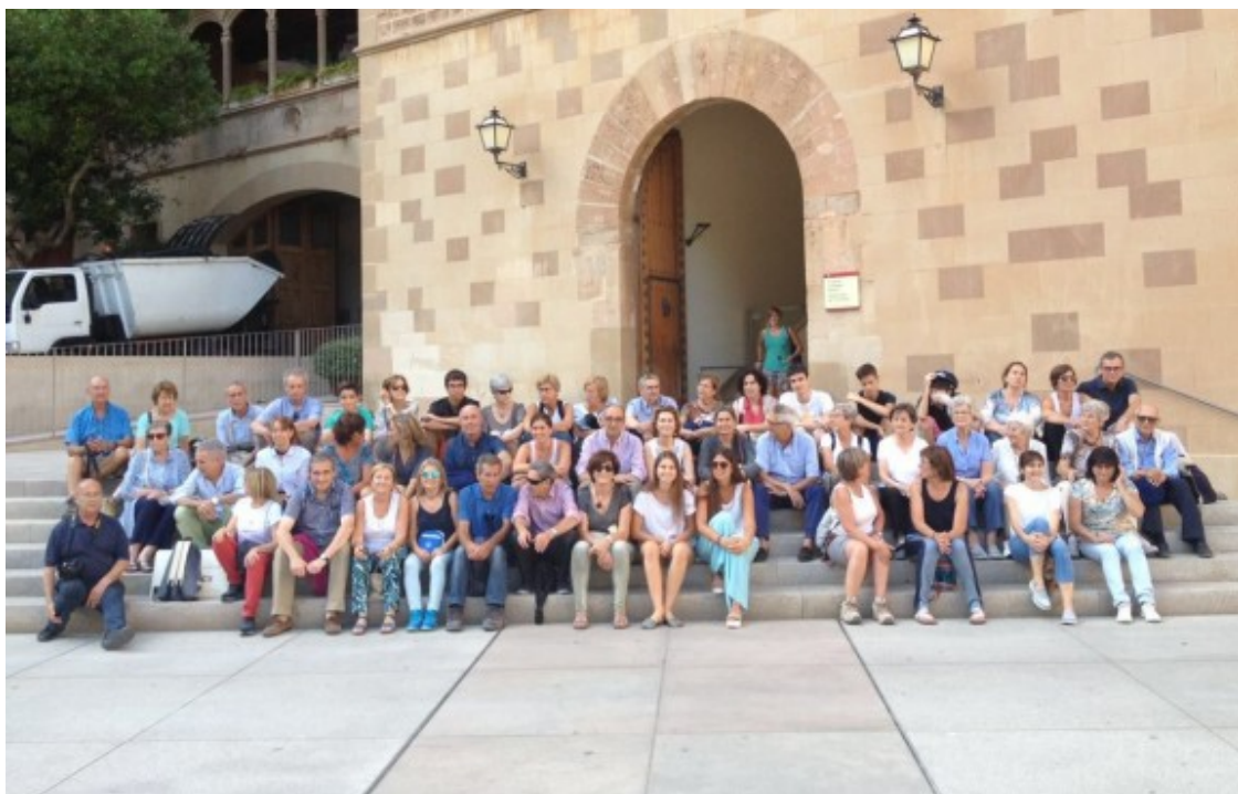
Fotografia dels descendents al monestir de Montserrat

Fills, néts, besnéts i rebesnéts del matrimoni format pel qui va ser director de l'Escola Industrial i la seva esposa van pujar a Montserrat amb motiu de l'efemèride