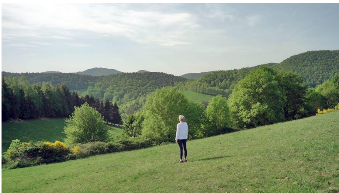
Imatge promocional de la nova proposta turística Vorater

Des del Consell Comarcal han impulsat una nova proposta turística que busca potenciar el benestar del visitant