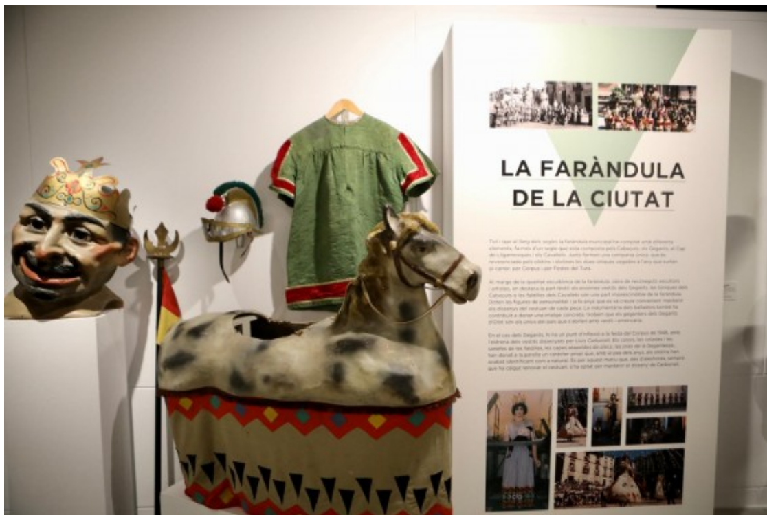
Totes les peces són les originals restaurades, amb rèpliques per a ballar-les durant les festes.

A les diferents estances de la Sala Oberta es podrà veure l'Àliga, el Drac, el Pollastre, el Conill o el Gat , entre d'altres elements de la faràndula. Es posa especial èmfasi en aquelles peces que tenen una estreta vinculació amb els tallers de sants , ja sigui perquè es van crear allà o bé perquè pertanyien a algun taller.