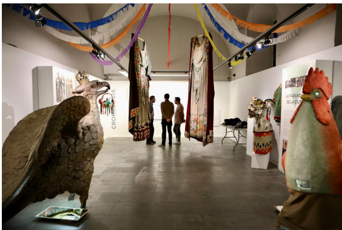
Figures i peces de la faràndula olotina en una de les estances de la Sala Oberta. | Martí Albesa.

Des d'aquest dissabte i fins al 15 d'agost s'hi podrà descobrir com s'han fet i es fan les peces dels gegants o del bestiar, amb activitats per a tots els públics