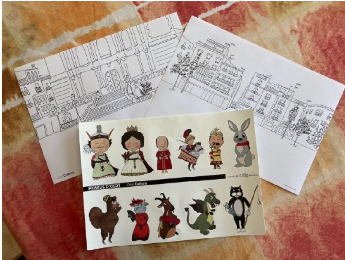
Les lamines per pintar i els adhesius de la faràndula perquè hi juguin les mainades.