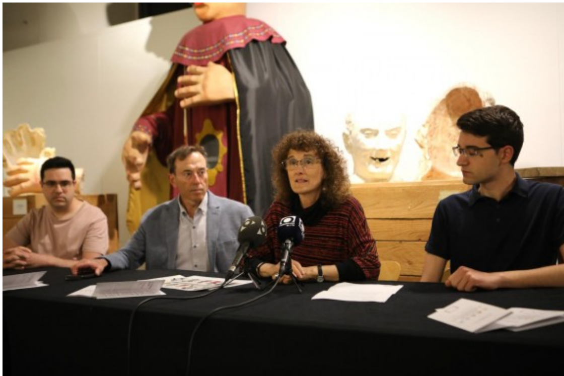
Un moment de la presentació de l'exposició a la Sala Oberta del Museu de la Garrotxa.