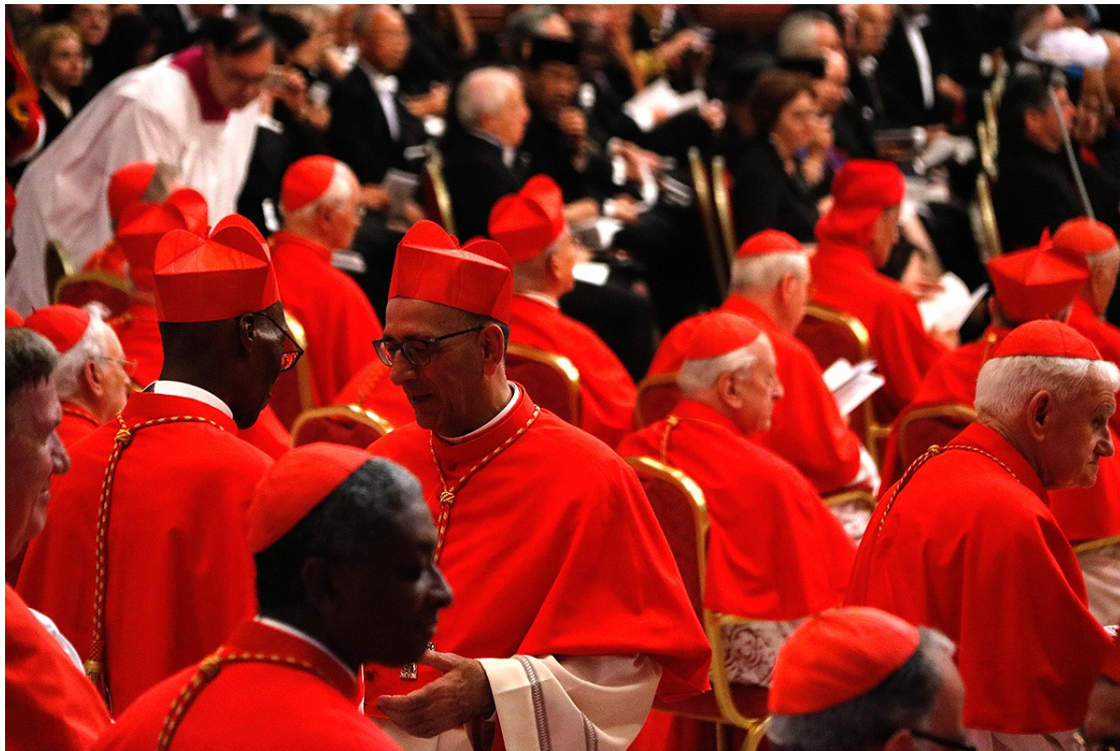
Juan José Omella envoltat d'altres cardenals a Roma.

El Vaticà ha d'omplir les vacants a les seus episcopals de Girona, Terrassa i Solsona en paral·lel a l'elecció del nou abat de Montserrat