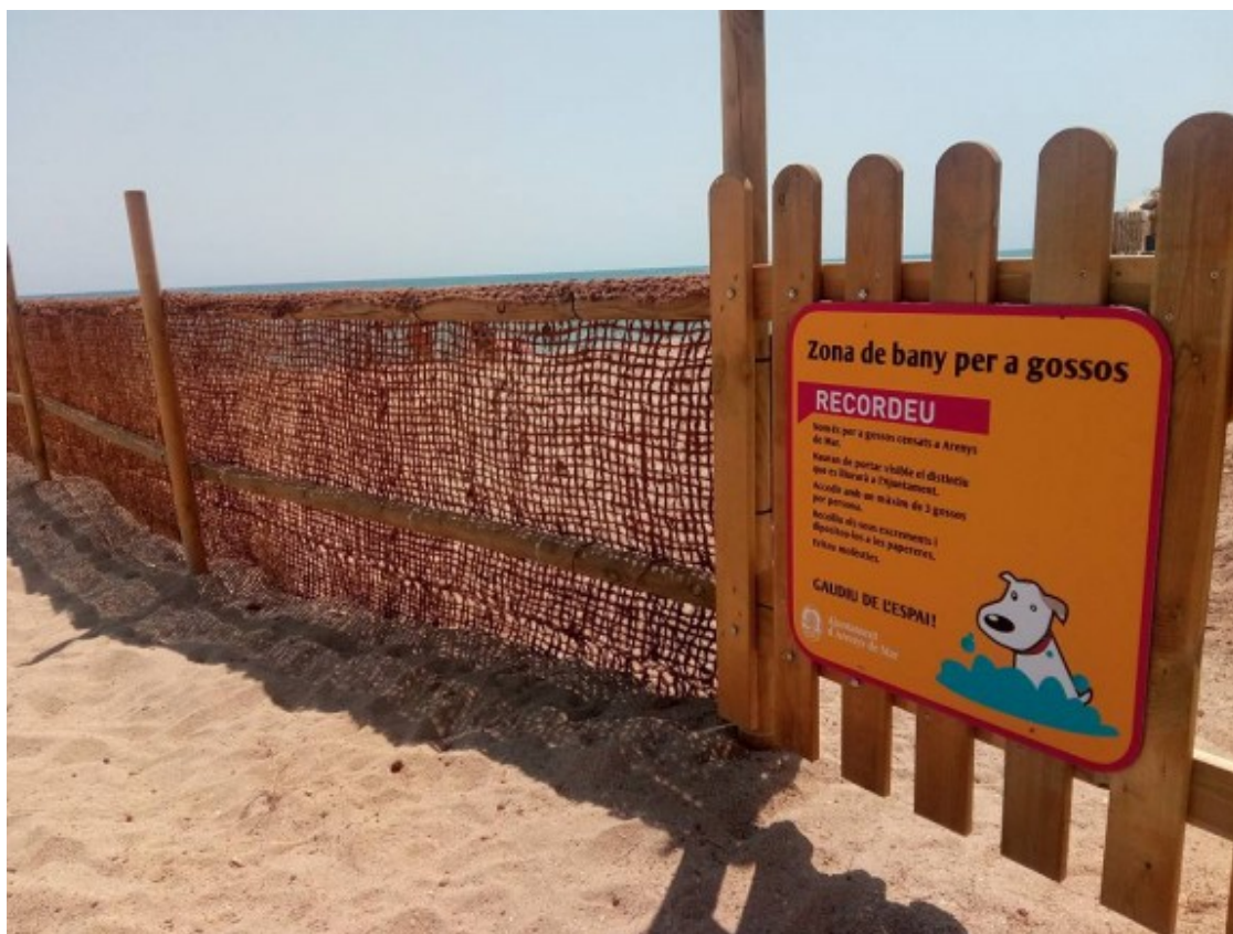
L'espai per a gossos a Arenys de Mar.