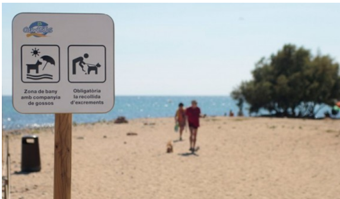
Platja de Cambrils per a gossos.