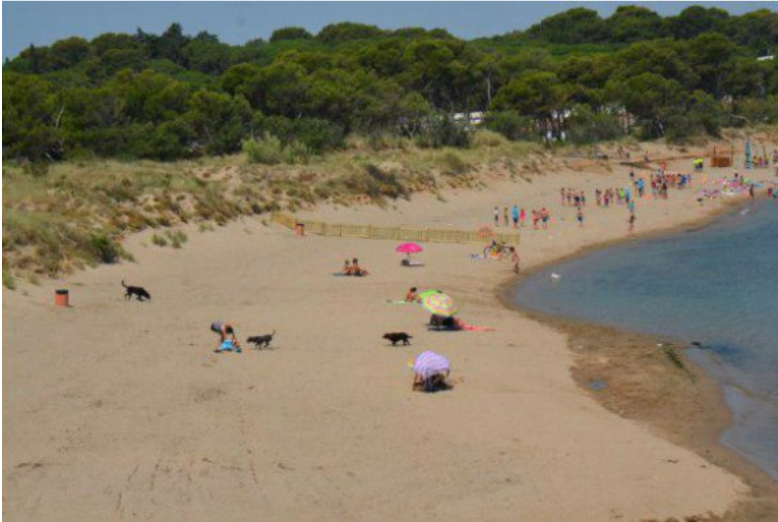
Platja del Rec del Molí de l'Escala.