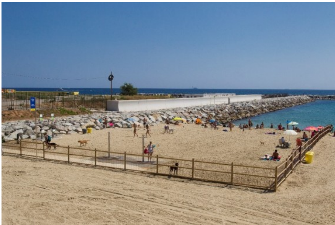
La platja de gossos de Barcelona.