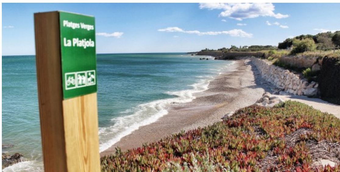
La platja d'Alcanar apta per a gossos.